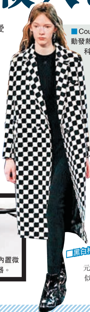
Courreges 自動發熱長褸結合科技與時裝於一身。

不少女士「愛親不愛命」，即使嚴寒亦堅持衣衫單薄，法國時裝品牌Courreges便在舉行的巴黎時裝周上，展示最新研發的「自動發熱長褸」，結合頂尖科技與高級時裝，無疑是一眾貪靚女士過冬的恩物。