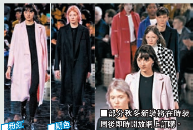
部分秋冬新裝將在時裝周後即時開放網上訂購。

設計師邁爾及瓦揚形容，發熱長褸同時符合女士們對美觀和舒適的要求。長褸內置微型發熱器，原理類似汽車座椅的發熱裝置，目前有粉紅、黑色及黑白格仔3款。