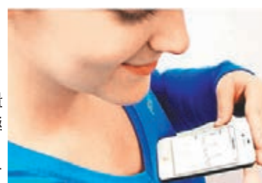
研究指量血壓app「極不準確」。