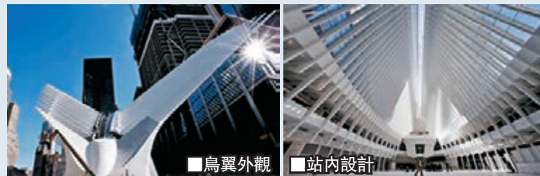
鳥翼外觀 站內設計

位於紐約世貿中心原址旁的「世貿中心火車站」昨日開幕，這個車站早於「911」襲擊後計劃興建，但多年來完工期多次延遲，造價亦由最初的20億美元(約155.5億港元)起，升至最終的38.5億美元(約299.4億港元)，成為全球最貴火車站。 車站由西班牙著名建築師卡拉特拉瓦設計，外形像鳥翼，名為「圓頂」，連接紐約地鐵系統與通往新澤西州的火車線，設有眾多商舖及餐廳。