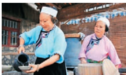
身穿600年前明代風格的長服，是屯堡居民的常態。

在貴州省安順市，有一群人至今身上還穿着具有600年前明代特色的寬袖窄長服，生活、勞作。歷史，被他們「穿成」了文化符號，這個符號叫「屯堡」。