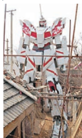
6米多高的高達為全木材製作。

山東省泰安市一個農家小院裡，近日出現了一個實木製作的體型巨大的高達獨角獸，這個製作精良的高達不僅引來了絡繹不絕的參觀者，還是全球唯一一個木質高達獨角獸，中國第一個大型高達獨角獸。