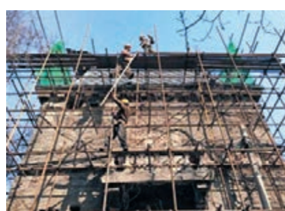
有京城「第一凶宅」之稱的朝內大街81號老樓已經啓動修繕。

「朝內81號搭上腳手架了。」前日上午，一則關於朝內大街81號院修繕的消息在網絡上傳開。這座曾一度被冠以「京城第一凶宅」之名的老樓，其實是民國時期美國天主教會用作培訓學校的老樓。近日，這座百年老樓已封閉大門，開啟修繕工作，預計今年10月能再次對遊客開放。