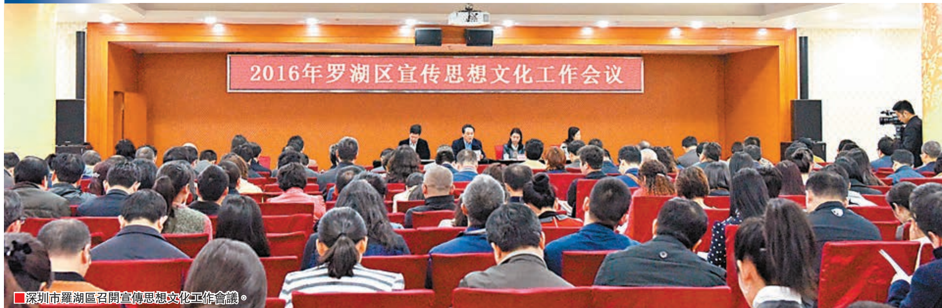
2016年罗湖区宣传思想文化工作会议