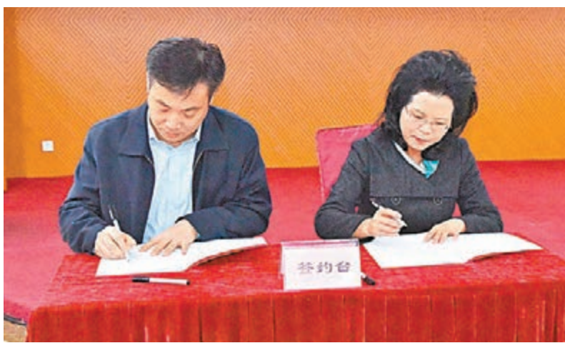
羅湖區各責任單位簽訂目標責任書。

同時，推動與促進文化與時尚、科技、金融、電子商務深度融合，孵化城市文旅新興業態。全力發展時尚文化，整合黃金珠寶、工藝美術、服裝等時尚產品資源，完善產業鏈條，打造深圳時尚文化集聚地。積極發展城市文旅，整合和優化深圳工藝美術集聚區、深圳古玩城、梧桐山藝術小鎮空間佈局，增加文化元素，打造具有「文化+旅遊」功能的文化產業園區。加快發展文化電商，打造「羅湖區電子商務示範基地——家居飾品電商主題園」平台、動漫產業交易網，實現線上線下交易互動。 深圳報道