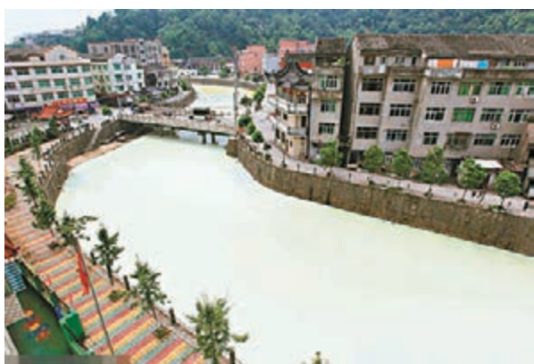
中國此前數十年粗放發展積累的環境問題正在集中顯現。圖為浙江省溫州市瞿溪河因乳膠洩漏變「牛奶河」。