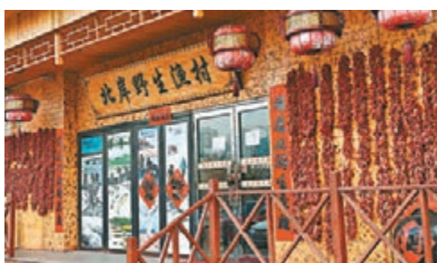
「天價魚」涉事飯店已經停業。