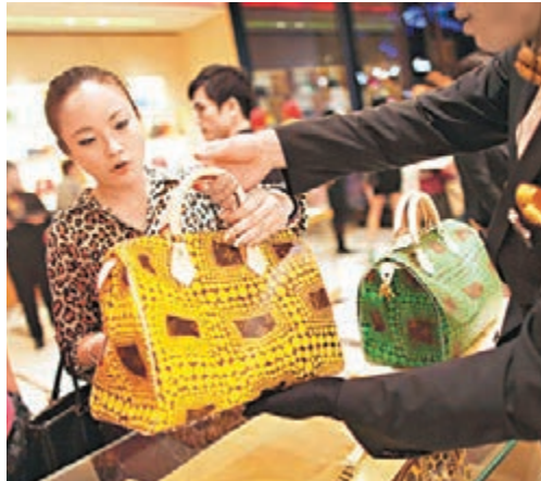
LV剛進駐上海時受到熱捧。圖為顧客在上海某LV店內選購手袋。