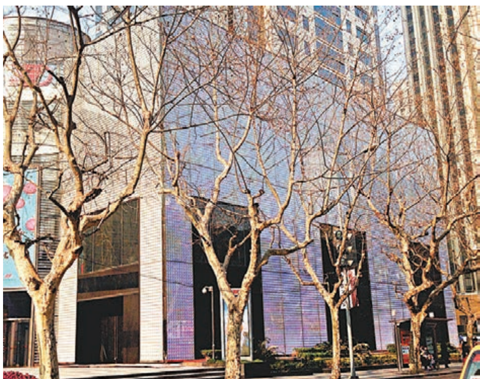
LV淮海旗艦店門楣上原有的Louis Vuitton字樣已被剷除。

另據不完全統計,在過去幾年,Prada在中國開了16家門店,Burberry開了3家門店。此外Coach、Loewe、Salvatore Ferragamo、Zegna等奢侈品牌亦有關店行為。