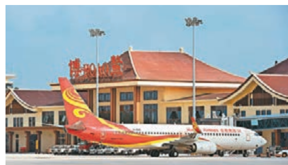
昨日,海南航空波音737-800型客機停在博鳌機場。