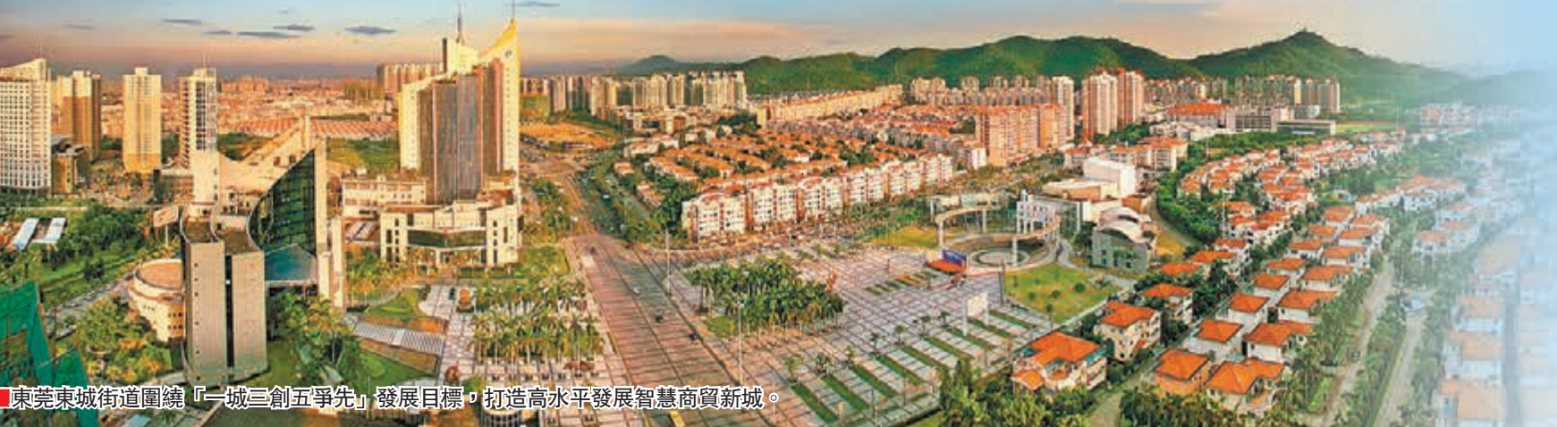
東莞東城街道圍繞「一城三創五爭先」發展目標，打造高水平發展智慧商貿新城。

提高效能，改革取得新突破。力爭在行政服務、產業升級、社會治理等改革方面取得新突破。繼續在商事登記改革制度、企業項目行政審批、外商投資服務、項目規劃建設等方面加大優化力度，營造高效的營商環境。以智慧城市智能中心為基礎平台，建立公共服務數據庫，打造城市智能應用體系，切實讓群眾感受到智慧城市的便利和舒適。通過信息技術打通市場、政府、企業等各個環節，有力推進信息化、城市化、工業化的深度融合。推行社會網格化管理，將公共安全、市場監管、城市衛生、環境保護、民生服務等各類信息融合共享，全面提升行政服務效能和社會治理水平。