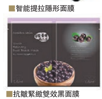
智能提拉隱形面膜 抗皺緊緻雙效黑面膜

例如，韓國製造的 Yu Skin 特意推出一款全新獨特並具有「智能記憶」功效的面膜——智能提拉隱形面膜，集清潔、修護、緊緻、去角質於一「塊」，採用提拉緊記憶技術，以及專利緊緻記憶成分瑪卡萃及蒺藜皂苷元，記載青春輪廓，有效提升緊緻之餘，再把緊緻輪廓記錄下來，令肌膚牢牢黏着同一緊緻及提拉度。其撕揭式面膜撕拉時能溫和地帶走老化角質，效果顯著。在深層潔淨肌膚外同時有助吸收養份及修護受損的皮膚，瞬間讓肌膚重拾年輕光澤。