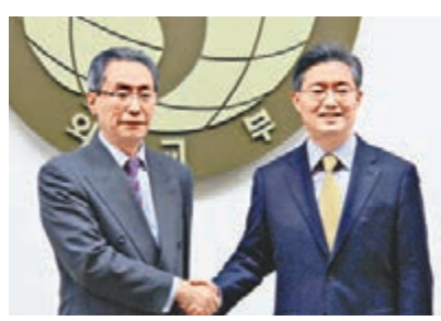
會談中,武大偉(左)與黃浚洙握手合影。

另據中國外交部網站消息,中國外交部昨日也表示,朝鮮近期核試、射星違反了聯合國安理會決議,安理會