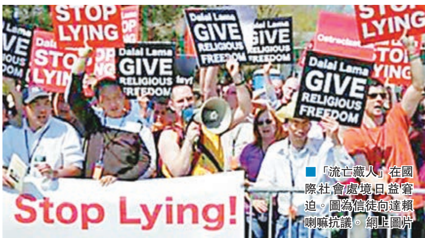
「流亡藏人」在國際社會處境日益窘迫。圖為信徒向達賴喇嘛抗議。

香港文匯報訊 有「藏獨」媒體報道稱,2月28日所謂的「西藏流亡政府外交與新聞部部長」宣佈辭職。這位官員在辭職聲明中指出,是為了應對擺在眼前的「重大事宜」,具體原因將會在今後找個恰當時機說明。可見,這位「外長」的辭職還是與3月20日將要舉行的「西藏流亡政府大選」有關,也從側面印證了達賴集團內鬥升級的事實。據中國西藏網報道,雖然沒有說明具體的辭職原因,但從「藏人行政中央內閣」隨後舉行的新聞發佈會上可以看出些端倪。所謂的「西藏流亡政府司政」說:「(「外長」)在今早書面請辭後,也用口頭表示,原因之一是為了便於參加正在進行的西藏流亡社區『大選』辯論活動,而在職部長依相關法規無法自由參與活動,因此提出請辭。」