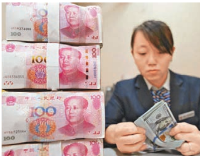
昨日,人民幣兌美元匯率中間價報6.5385,上調67個基點。圖為內地某銀行職員在點算鈔票。資料圖片

香港文匯報訊 中國人民銀行副行長陳雨露昨日表示,根據測算,國際清算銀行(BIS)發佈的人民幣實際有效匯率至少被高估10%左右,人民幣不存在持續貶值的基礎。保持人民幣對一籃子貨幣的基本穩定,加大參考一籃子貨幣的力度,是未來人民幣匯率形成機制的主基調。