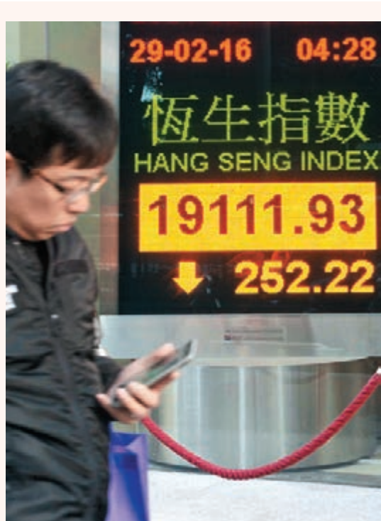
■ 港股近10個月內第9個月下跌。在2月最後一個交易日跌252點,成交增至643億元。 中通社

香港文匯報訊(記者 周紹基) 港股在2月最後一個交易日隨A股下跌,恒指跌252點或1.3%,收報19,111點。A股及港股下跌,主要因盤中有外電報道,指「中央為免在經濟下行時再添煩添亂,傳『深港通』將要擱置,並暫停QDLP、QDII2計劃,連浙商銀行也要推遲來港的IPO預路演。」不過,外匯管理局在收市後在官方微博發佈消息作出澄清,否認上述謠言。