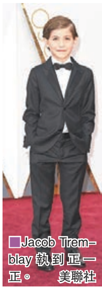
■ Jacob Tremblay 執到正一正。