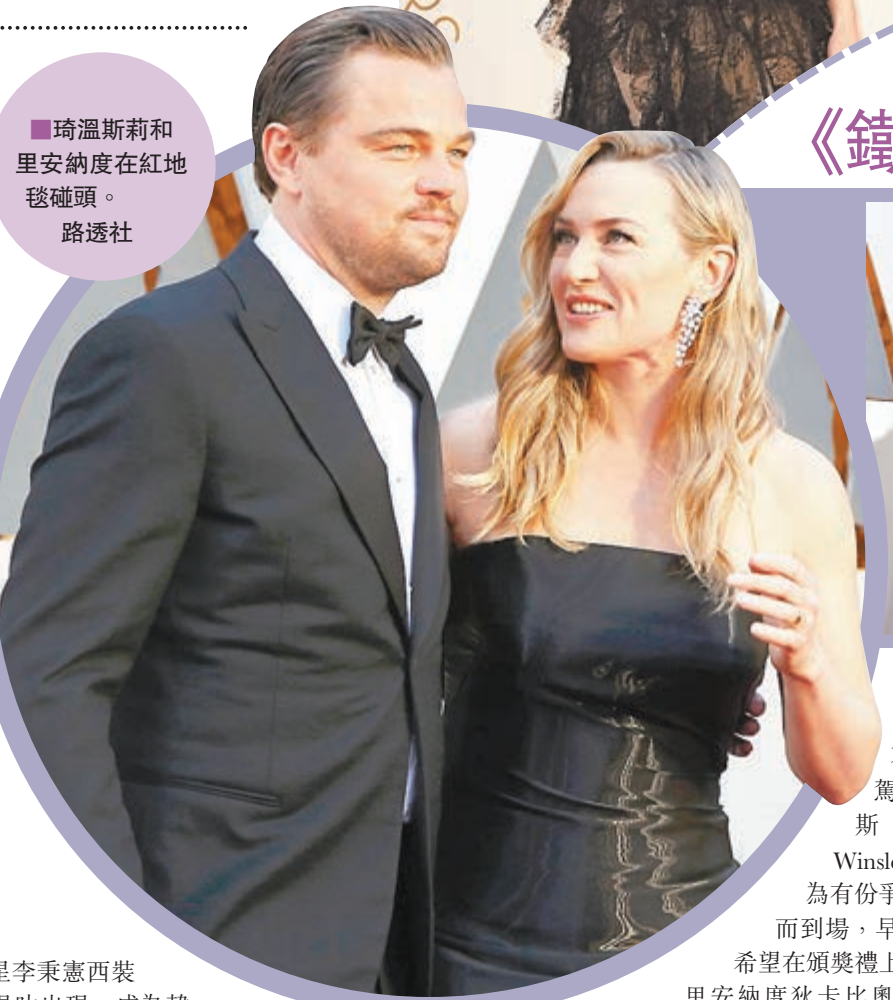
■ 琦溫斯莉和里安納度在紅地毯碰頭。

紅地毯亦少有地出現亞洲面孔，曾在電影《義勇群英之毒蛇反擊戰》(G.I. Joe: Retaliation) 等演出的