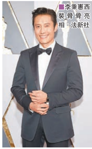
■ 李秉憲西裝骨骨亮相。