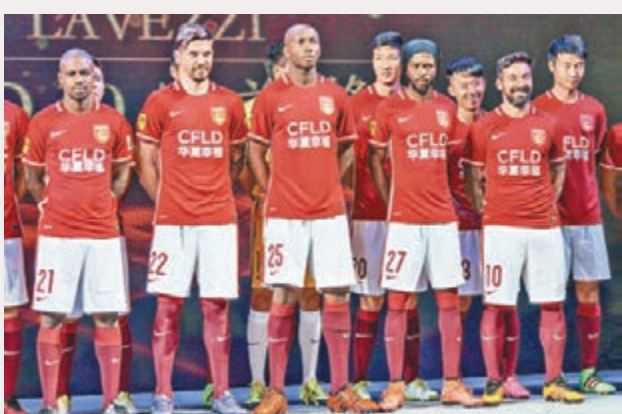
華夏強援悉數亮相。