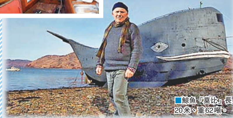
鯨魚「莫比」長20米、重62噸。