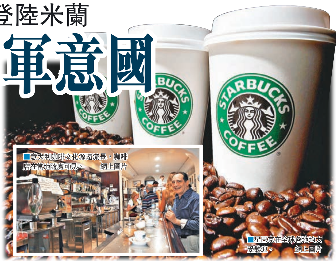
意大利咖啡文化源遠流長，咖啡店在當地隨處可見。網上圖片