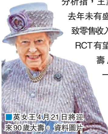
英女王4月21日將迎來90歲大壽。