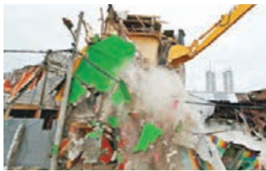
推土機清拆紅燈區房屋。

印尼政府昨日完成清拆首都雅加達姻緣河紅燈區的房屋，約5,000名軍警進駐維持秩序，未有激烈衝突。