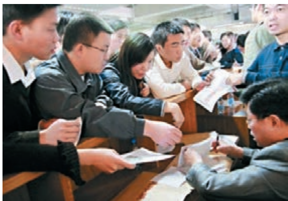
報名現場,畢業生爭先恐後報公務員。 本報廣州傳真

香港文匯報訊(記者 帥誠 廣州報道)2016年廣州市公務員考試招錄工作於昨日下午4時正式截止,計劃招收747個職位共1,090名公務員。據報名前四天的匯總情況顯示,今年的公務員市考,已有2.2萬餘人報名。和往年的公務員報名冷熱不均情況一樣,部分熱門職位競爭者多達百人,部分基層職位則無人問津。