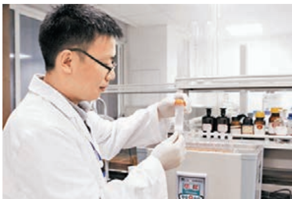
去年內地食品抽檢合格率是96.8%。圖為重慶市食藥監局工作人員正在檢測大米。 資料圖片

另據中國經濟網早前報道,抽檢的17萬批次食品樣品中,抽樣品種覆蓋25個食品大類,其中,糧、油、肉、蛋、乳等大宗日常消費品合格率均接近或高於平均水平。