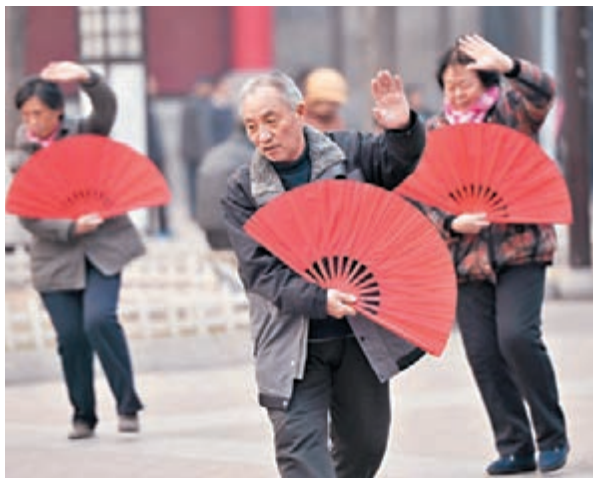
養老保險制度改革正在推進,預計到2020年將實現養老保險全民覆蓋。

香港文匯報訊(記者 江鑫 北京報道)人力資源和社會保障部部長尹蔚民29日在國新辦發佈會上表示,目前人社部已確定延遲退休方案,要按相關程序報批後才能公開並向社會徵求意見,「今年肯定會拿出方案」。另外,目前中國養老保險基金無缺口,養老保險制度改革正在推進,預計到2020年將實現養老保險全民覆蓋。