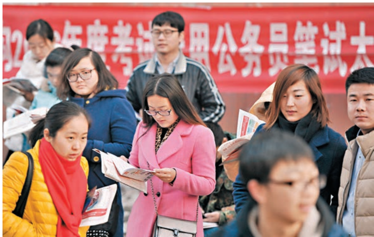
報考公務員是內地高校畢業生就業的重要選擇之一,報考職位常出現冷熱不均,熱門職位常競爭激烈,部分基層職位則無人問津。

有特別熱門的職位,也就有相對冷門的職位。根據報名系統統計顯示,廣州荔灣、越秀、增城等區的基層城管執法隊員職位中,依然存在個別職位、崗位無人報名,白雲新市街、增城中新鎮的個別街道基層公務員職位,也僅有寥寥一兩人報名。記者通過採訪數位應屆畢業生了解到,考公務員在部分畢業生心目中已經不是最佳選擇。今年即將