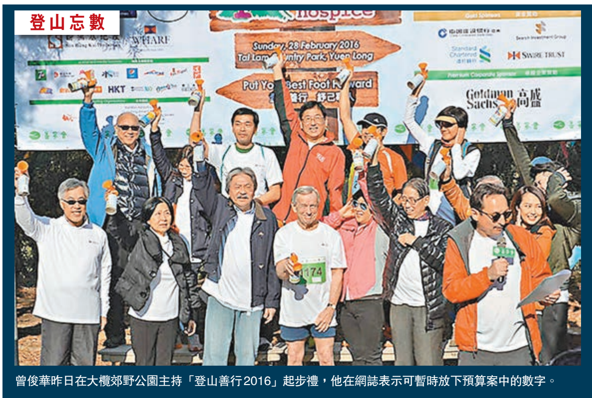
曾俊華昨日在大欖郊野公園主持「登山善行2016」起步禮，他在網誌表示可暫時放下預算案中的數字。

他說，社會福利方面，今年新增主要開支是每年撥款29億元推行的低收入在職家庭津貼計劃。他們希望這計劃可