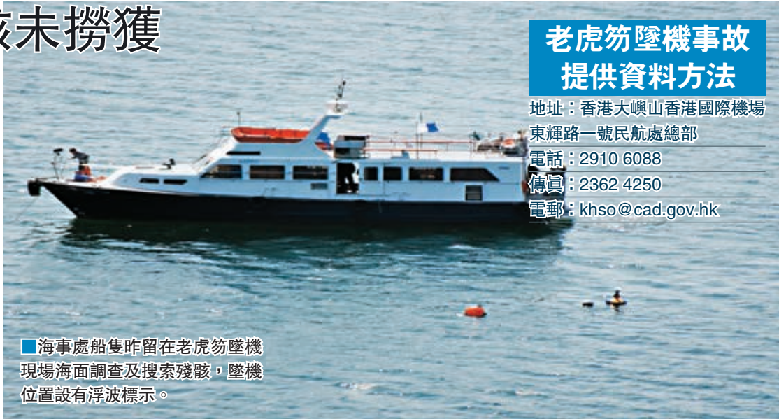
■海事處船隻昨留在老虎笏墜機現場海面調查及搜索殘骸，墜機位置設有浮波標示。

民航處發言人表示，民航處的意外調查主任昨日到出事現場蒐證，獲土木工程拓展署提供協助，研究可行的打撈計劃；發言人強調會繼續循多方面進行調查，包括到香港飛行總會進行調查等，並呼籲任何人士如目擊意外，或者有相關的資料/影像提供，請聯絡總意外調查主任。（見表）