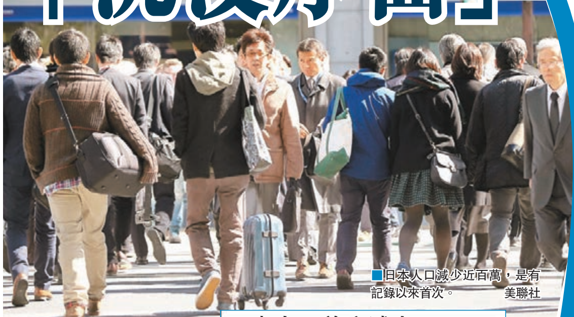
日本人口減少近百萬，是有記錄以來首次。

日本出生率低迷，人口老化嚴重，總務省昨日公佈去年普查結果，更顯示總人口減至1.2711億，較2010年的上次普查減少94.7萬，是1920年有統計以來首次。《衛報》指出日本5年間減少的人口已超出美國三藩市的總人口，且趨勢將持續，可能拖累經濟。《產經新聞》更形容人口下跌可能是「日本沉沒的序曲」。