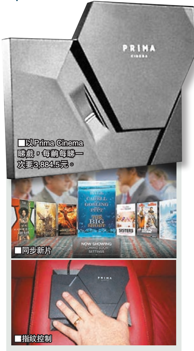
以Prima Cinema睇戲，每齣每睇一次要3,884.5元。