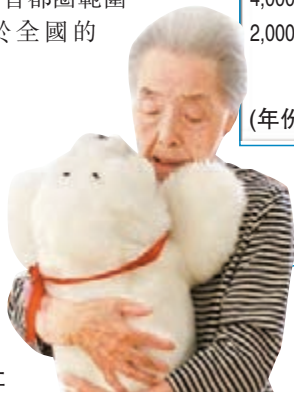
日本人口老化問題嚴重，引伸出很多社會問題。

日本首相安倍晉三提倡「一億總活躍社會」，但專家指出，要維持1億人口，生育率須由2012年平均每名女性生育1.41人，大幅提升至2.1人，高過政府設定1.8人的目標。日本政府前年一份研究報告顯示，若人口少於1億，到了2040年國家將陷入長期經濟衰退。