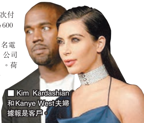
Kim Kardashian和Kanye West夫婦據報是客戶。