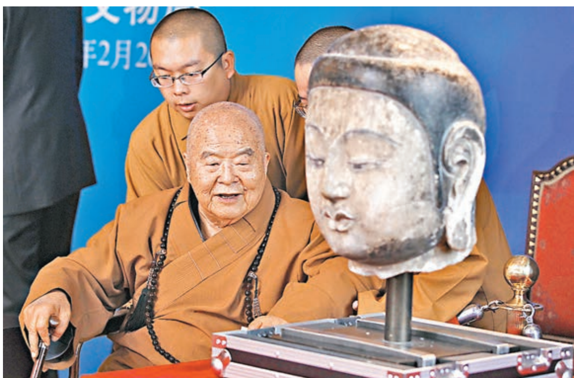
台灣佛光山星雲大師攜其捐贈的北齊佛首抵達北京首都國際機場。

昨日凌晨5時，90歲高齡的星雲大師從台灣啟程，親自護送佛首回家。當星雲大師乘坐輪椅出現在首都國際機場時，全場響起熱烈的掌聲。中午12時，經過海關查驗和開箱，這尊代表北齊時期佛教造像雕刻藝術最高水平的釋迦牟尼佛首出現在眾人眼前，工藝精細、法相莊嚴，面相豐滿，雙目微啟，神態安詳。