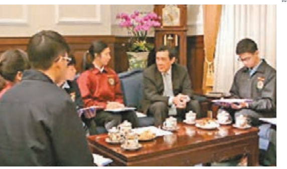
馬英九接受中學生訪問。

最後談到他的工作，馬英九表示，這份工作時間長，決定影響深遠，需要很多耐性，要能忍受批評，但理想能實現，是很好的回報。