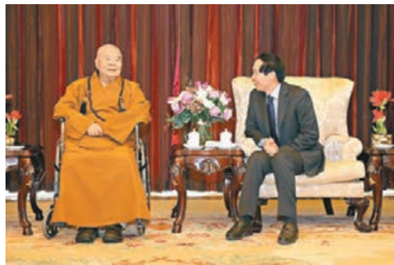
國家文物局局長劉玉珠在機場貴賓廳與星雲大師交流。

香港文匯報訊(記者 江鑫嫻 北京報道) 20年前被盜往海外的河北幽居寺北齊釋迦牟尼佛像的佛首，於26日中午由台灣星雲大師親自護送，抵達北京首都機場。佛首歸家的背後，是一段海峽兩岸合力促成文物回歸的佳話。星雲大師以「兩岸一家親」來形容這一盛事，「海水隔不斷兩岸血緣關係」。