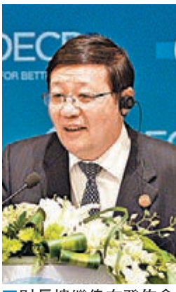
財長樓繼偉在發佈會上發言。

此外，他還解釋，近兩年內地稅收增長低於GDP增長，但財政收入增長高於GDP增長，靠的是特殊措施，主要是國有企業上繳利潤。