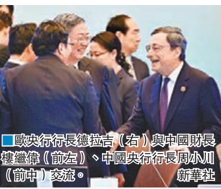
歐央行行長德拉吉(右)與中國財長樓繼偉(左前)、中國央行行長周小川(前中)交流。

美國財政部長杰克盧亦敦促各國避免貨幣競相貶值。他在出席G20財長會議時稱，「美國反對以鄰為壑的政策」，環球央行動用所有可用的政策工具來應對全球需求短缺，這種做法越來越重要，「這意味著要同時施行財政手段、貨幣政策及結構性改革」。