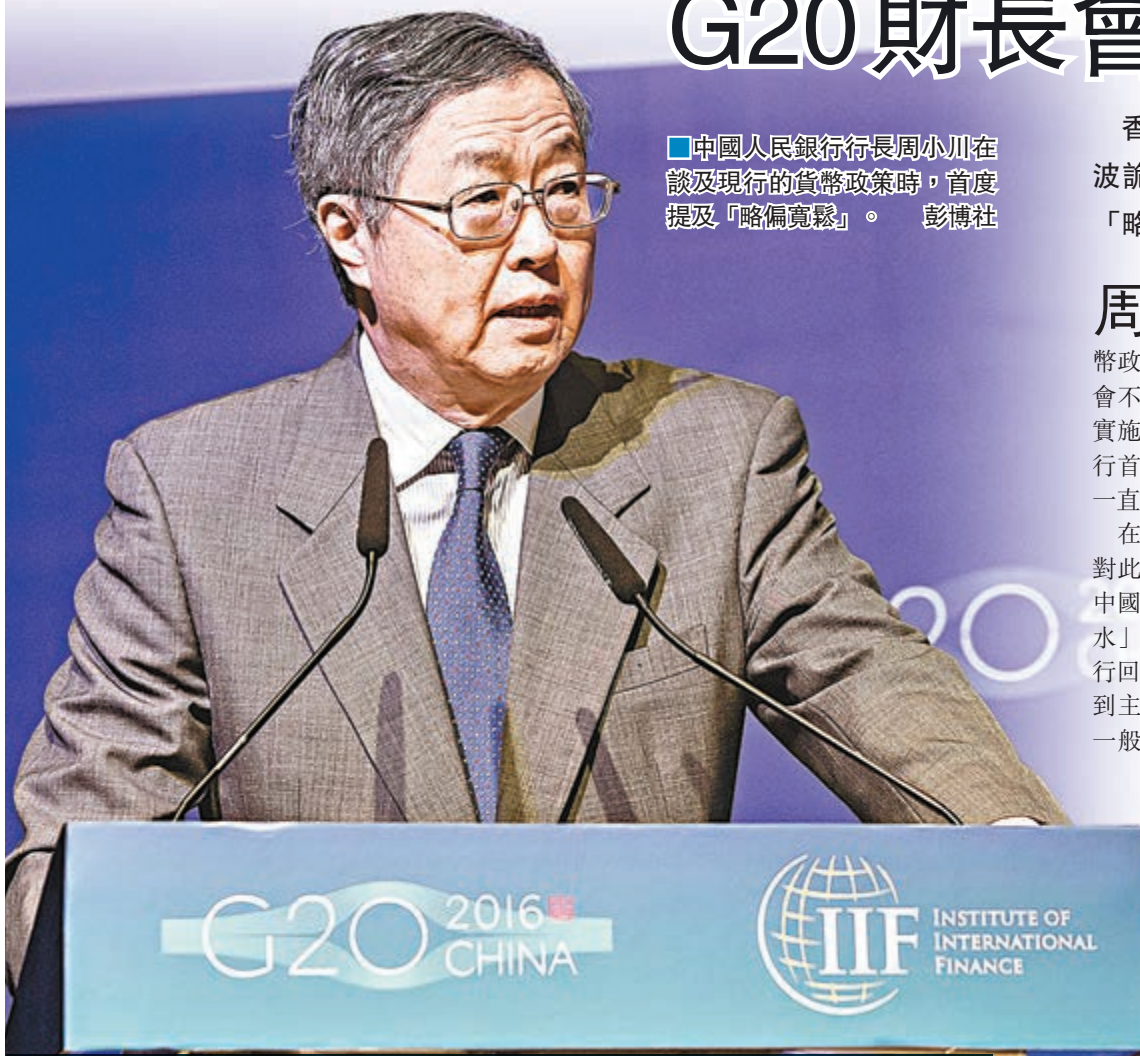
中國人民銀行行長周小川在談及現行的貨幣政策時，首度提及「略偏寬鬆」。

香港文匯報訊(記者 章蘿蘭 上海報道) G20財長和央行行長會昨日於上海揭幕，當下國際金融市場波詭雲譎，中國的政策走向備受關注。中國人民銀行行長周小川在談及現行的貨幣政策時，首度提及「略偏寬鬆」。他還強調，中國制定貨幣政策不會過度基於外部經濟。