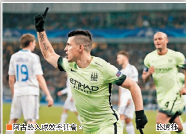
阿古路入球效率甚高。