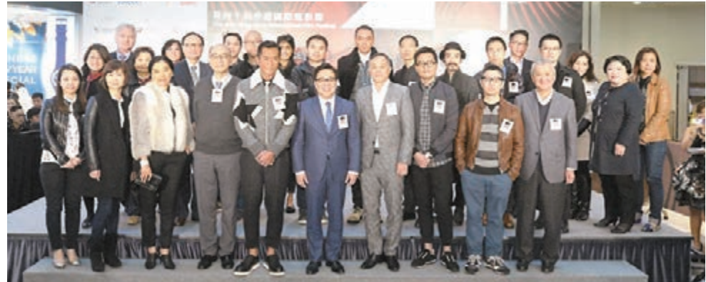
第四十屆香港國際電影節日前公佈兩華語片成開幕電影。

園子溫，本屆電影節選映了他的《我是園子溫！！》、《男之花道》、新作《新宿天鵝》及《耳語星球》。四位導演均帶同他們的最新作品訪港，機會難逢。 本屆電影節將以四部韓片聚焦韓國電影，有李光洙主演的《魚男突變》、李秉憲擔綱的《寒流黑金》、李在容執導的《神女觀音》及著名導演林權澤執導，威尼斯影后姜受延主演的《借種》。新韓國電影的代表人物之一朴起鏞導演，及香港國際電影節協會總監高思雅，將於3月24日出席「全球影業培訓」講座，憑東入場。由法國駐港總領事館、法國電影聯盟及香港國際電影節協會合辦的「法國之夜」，將放映何德莉愛絲圖高執導的《鎖不住的溫柔》，女主角蘇菲瑪素將親臨香港與觀眾會面。