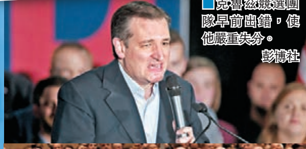
■克魯茲競選團隊早前出錯，使他嚴重失分。