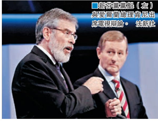
■新芬黨黨魁(左)與愛爾蘭總理肯尼出席電視辯論。