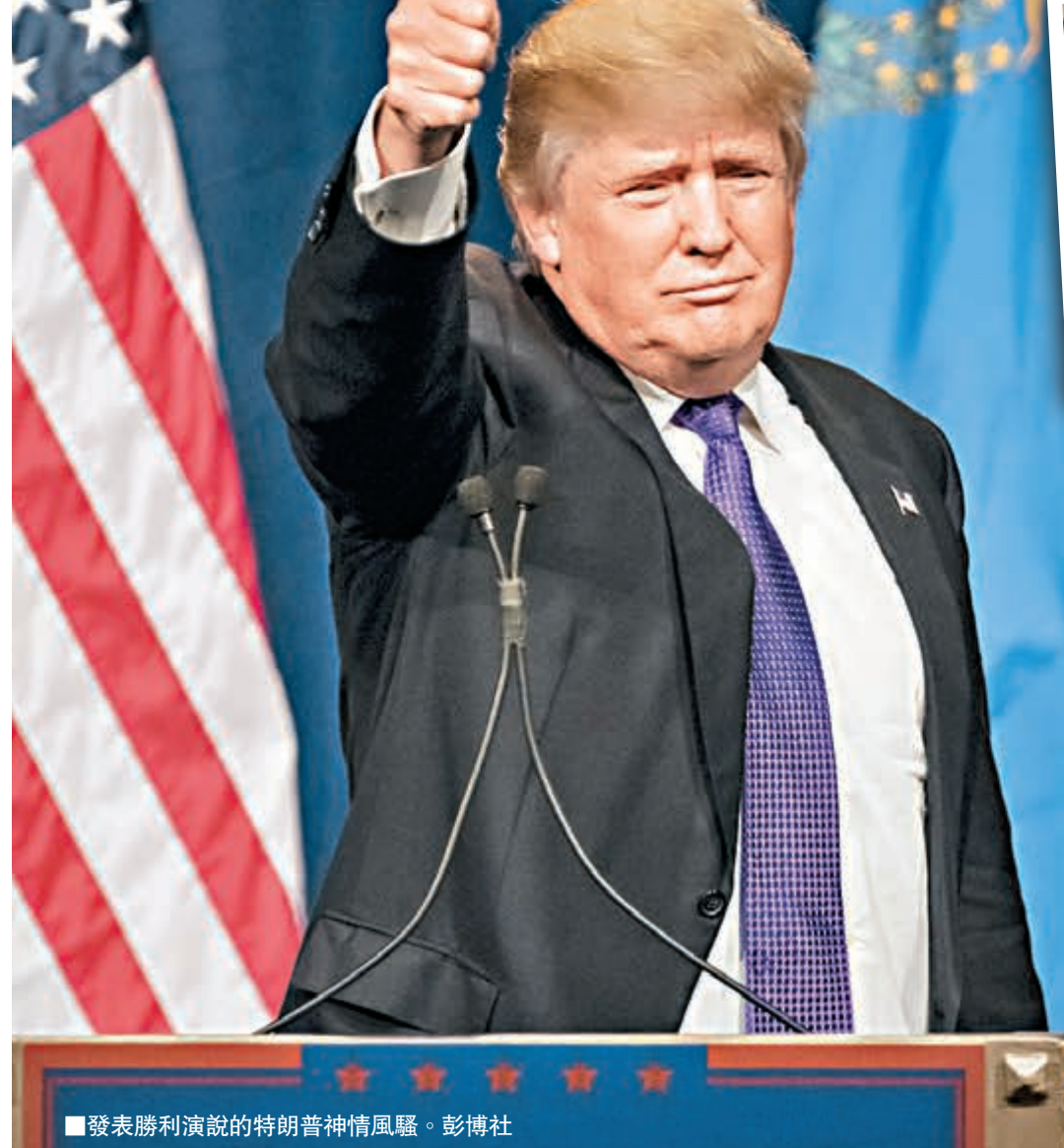
■發表勝利演說的特朗普神情風騷。