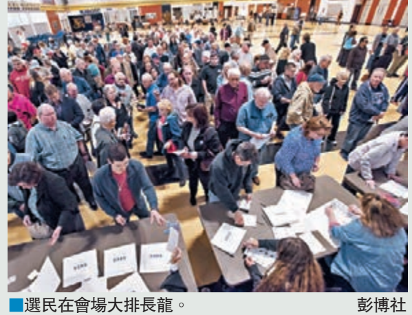
■選民在會場大排長龍。

共和黨內華達州初選以黨團會議形式進行，規則較一般投票複雜，加上今屆出席會議人數創新高，不少會場大排長龍，選票數量不足，場面混亂。多個會場接獲投訴指有人重複投票，票站義工未有仔細檢查選民身份，甚至無視中立原則，在分發選票及點票期間穿上寫有特朗普名字的衣服。