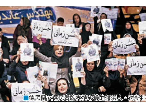
■德黑蘭女選民舉牌支持心儀的候選人。