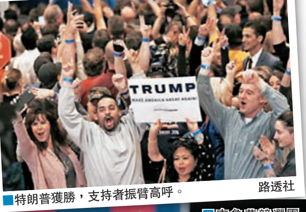
■特朗普獲勝，支持者振臂高呼。