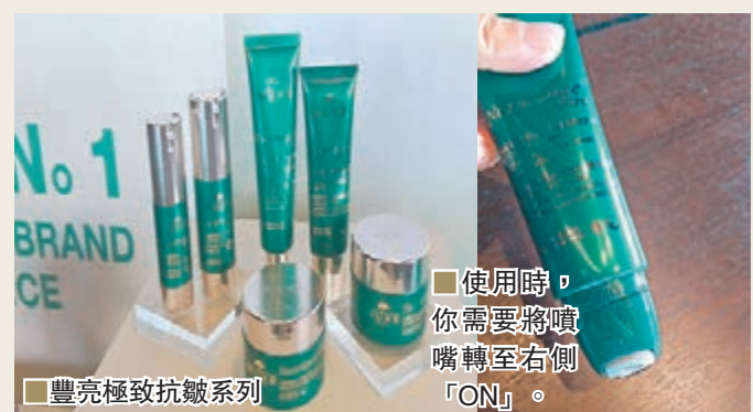
■示範利用滾珠於皺紋上按摩

其使用方法特別，你需要將噴嘴轉至右側「ON」，然後利用滾珠於面部中央向外塗抹，再由面部到頸部，如日間可敷 10 分鐘後用爽膚水抹走即可，晚間則可塗抹全部面部後利用滾珠於皺紋上按摩，敷 10 分鐘待面膜完全吸收，再用爽膚水抹走多餘面膜即可。