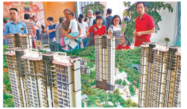
中國財政部上周宣佈調減房地產契稅及營業稅，有利房地產去庫存。圖為內地一樓盤銷售廳。資料圖片

去年9月30日以來，五個月內中國政府針對房市連推了四大刺激政策，財政部在2月19日再推新政策降低房地產交易稅負，反映了高層對房地產去庫存的堅定信心，在這種信號的作用下，疊加貨幣、財政政策確實在一定程度上降低了購房者的買房壓力，將有助於房地產去庫存，也點燃了中國債券上升動能。 ■ 日盛投信