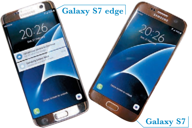
Galaxy S7 edge