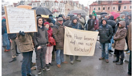
有民眾在起火外的難民中心示威，表達對難民的支持。

德國反移民極右組織「歐洲愛國者反西方伊斯蘭化」(PEGIDA)根據地薩克森州，州內包岑市一幢改作難民中心、預計收容3,900人的酒店