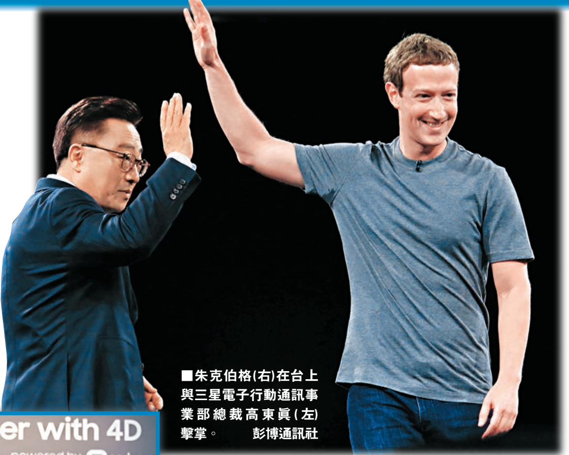
朱克伯格(右)在台上與三星電子行動通訊事業部總裁高東真(左)擊掌。