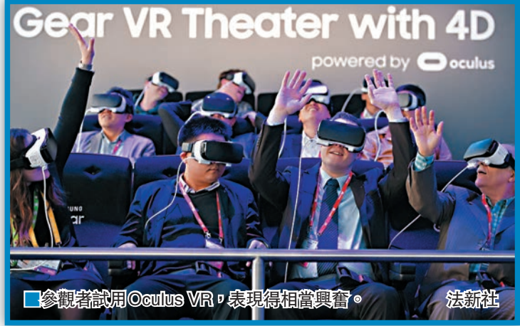
參觀者試用Oculus VR，表現得相當興奮。