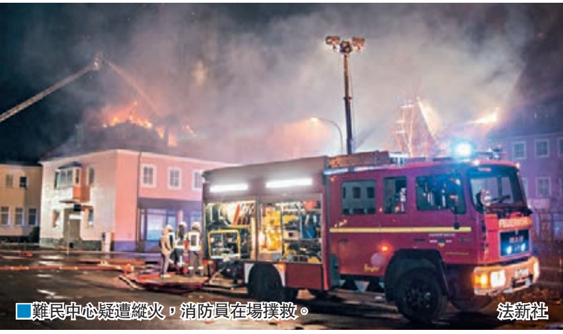
難民中心疑遭縱火，消防員在場撲救。

德國反移民極右組織「歐洲愛國者反西方伊斯蘭化」(PEGIDA)根據地薩克森州，州內包岑市一幢改作難民中心、預計收容3,900人的酒店