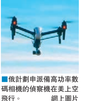
俄計劃申派備高功率數碼相機的偵察機在美上空飛行。

國務院前日回應指，各簽署國至今未收到俄方申請，基於條約規定申請需提前120日提出，因此俄方飛機最快要到今夏才會飛抵美國，指美方會按既定程序，驗證俄方飛機是否符合條約規定。