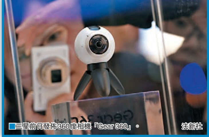
三星前日發佈360度相機「Gear 360」。