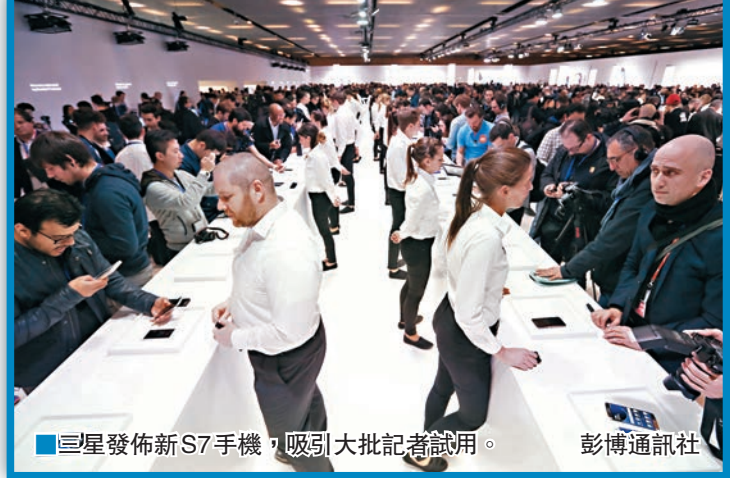
三星發佈新S7手機，吸引大批記者試用。