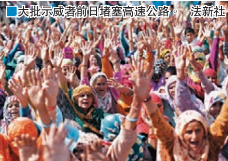
大批示威者前日堵塞高速公路。