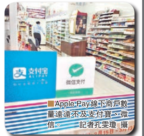
Apple Pay 線下商戶數量遠不及支付寶、微信。

有數據顯示，目前一個銀聯 POS 機安裝成本是 2,500 元 (人民幣，下同) 左右，而微信 POS 機是 2,000 元以上，孰真孰假一目了然。而且，阿里和騰訊向來也更擅長在商戶上進行補貼，Apple Pay 背後的銀聯，此前卻並不擅長此項運作。