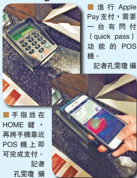
進行 Apple Pay 支付，需要一台有閃付 (quick pass) 功能的 POS 機。

另外，移動支付另一廣受關注的安全性能方面，蘋果顯然領先支付寶和微信支付。由於閃付採用的是支付標記，就意味着綁定在手機上的銀行卡號既不會存儲在設備上，更不會存儲在 Apple 的服務器上。且萬一手機掉了，因為沒有機主指紋，他人也是無法用支付功能。而蘋果手錶離開手腕的話，則會自動鎖死。