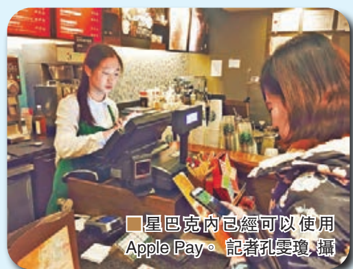
星巴克內已經可以使用 Apple Pay。

作為新生物，目前內地可以用 Apple Pay 支付的實體商店並未開展太多，有些即使可以使用，但因收銀人員培訓不到位等問題也都無法支付。