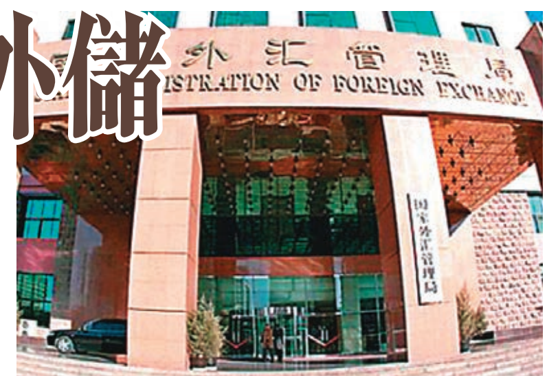
外匯局提醒，目前中國按照國際貨幣基金組織數據公佈特殊標準 (SDDS) 公佈外匯儲備構成。資料圖片

另外，國家外匯管理局昨日公佈，於 2 月 18 日人行副行長、國家外匯管理局局長潘功勝於北京，會見摩根士丹利總裁戴赫龍，雙方就全球經濟、中國經濟、近期全球金融市場波動及主要經濟體貨幣政策等議題進行了交流。