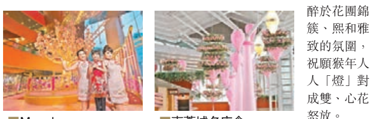
醉於花團錦簇、熙和雅致的氛圍，祝願猴年人人「燈」對成雙、心花怒放。

東薈城名店倉呈獻「燈」對甜蜜桃花園新春佈置，以「越」洋登港的越南全手工絲綢花燈及12呎巨型桃花粉飾商場，讓大家陶