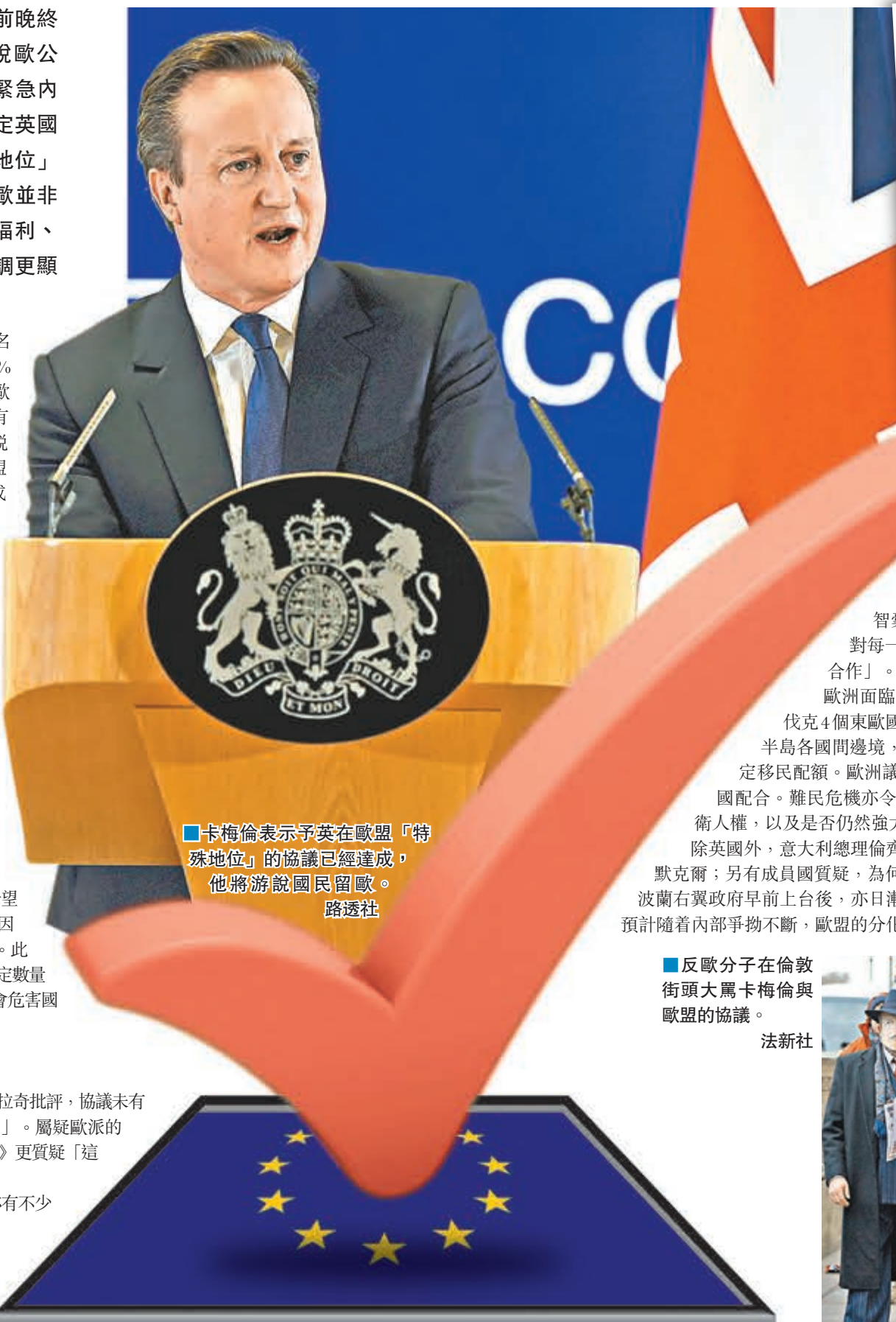
卡梅倫表示予英在歐盟「特殊地位」的協議已經達成，他將游說國民留歐。