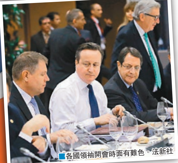
各國領袖開會時面有難色。