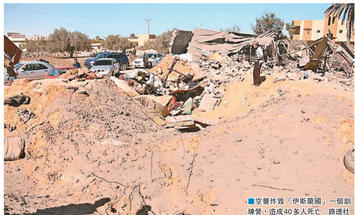
空襲炸毀「伊斯蘭國」一個訓練營，造成40多人死亡。