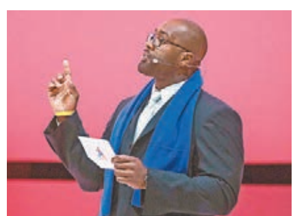
法國柔道好手泰迪韋拿上台致辭。

巴黎在周三舉辦大型記者會來造勢，請來多位現役及前體壇紅人撐場，以聲援法國總理瓦爾斯。他們在申辦報告中提到要提供奧運「新時代」，包括95%的現有或臨時場館，換言之僅得5%是全新建設。巴黎將以所處的巴黎大區作為奧運主要賽場，而法蘭西體育場不僅進行田徑項目，還將成為閉幕式的舉辦地。至於選手村則將設置到坐落塞納河畔、佔地50公頃的洛比桑電影城內，這樣可將逾8成奧運設施劃入半徑10公里的奧運圈內，保證85%參賽運動員能於半小時內抵達賽場。此外，包括巴黎和洛杉磯都表明承諾限制花費，若當選2024年奧運主辦城市便會以長久效益作大前提。比起巴黎的95%現存場館，洛城甚至提出97%的場館是隨手可用，「輕住辦」的意向非常明顯。另一方面，鑑於肯尼亞過去3年有逾