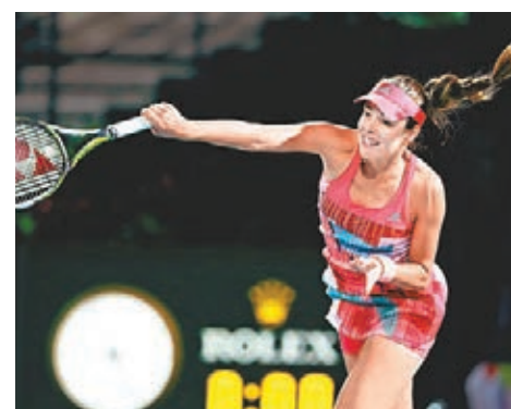
伊雲奴域(圖)在迪拜賽力克夏莉普。

程的里約熱內盧公開賽，法國球手宋加意外地以總數1:2不敵「本地薑」蒙泰羅，慘嘗「一輪遊」，宋加說：「即便比賽很艱難，但對我而言也是一次不錯的經歷。」記者 鄭御龍