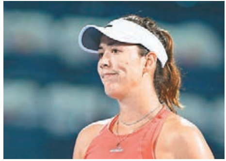
表現欠佳的梅古露莎面有難色。

於迪拜進行的網球錦標賽，周三爆出意外狀況，女單頭4名種子球手均在次圈出局，其中頭號種子羅馬尼亞的夏莉普被前「一姐」塞爾維亞好手伊雲奴域擊敗，無緣衛冕這項賽事冠軍。更甚是至今頭8名種子都已