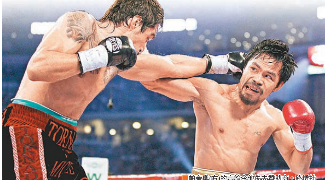
帕奎奧(右)的言論令他失去贊助商。

菲律賓TV5電視台稱同性伴侶連動物都不如：「你見過動物會和同性交配嗎？動物還是較好，因他們分清男和女。如男性跟男性交配，女性和女性交配，那便差勁過動物了。」這番話即在剛通過同性婚姻合法化的美國引起巨響。去年擊敗帕奎奧的梅威瑟，也在接受爆料網站TMZ訪問時表示：「我們應容許人們以他們想要的方式生活。」事後帕奎奧已透過Instagram公開道歉，堅稱非要譴責同性戀者，只是捍衛自己的基督教信仰。然而有剛與同性伴侶結婚不久的菲國女歌手公開要求民眾別在稍後的大選投票給他，未知會否影響帕奎奧角逐參議員的機會。記者 鄭御龍