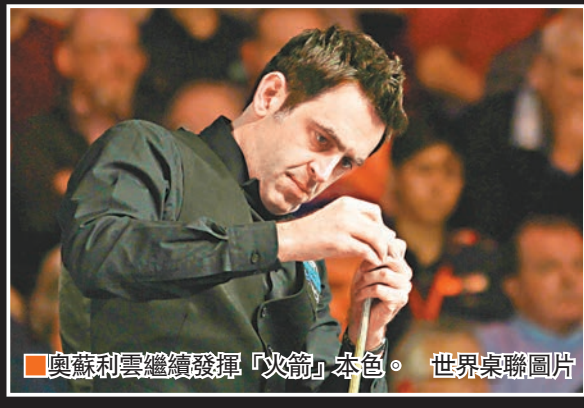
奧蘇利雲繼續發揮「火箭」本色。