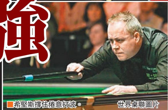
希斯擄住倦意切波。