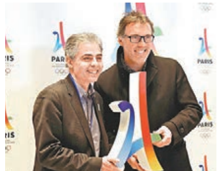
前法國乒乓球名將蓋亨(左)跟巴黎聖日耳門主帥白蘭斯，出席巴黎申奧記者會。

40名田徑運動員涉服禁藥，國際田聯表示除非肯尼亞獲世界反興奮劑組織證明清白，否則有機會禁止他們參加今夏的里約奧運。記者 鄭御龍