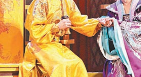
由劉曉慶、天津人民藝術劇院劇組演員表演的話劇《武則天》在加拿大上演。