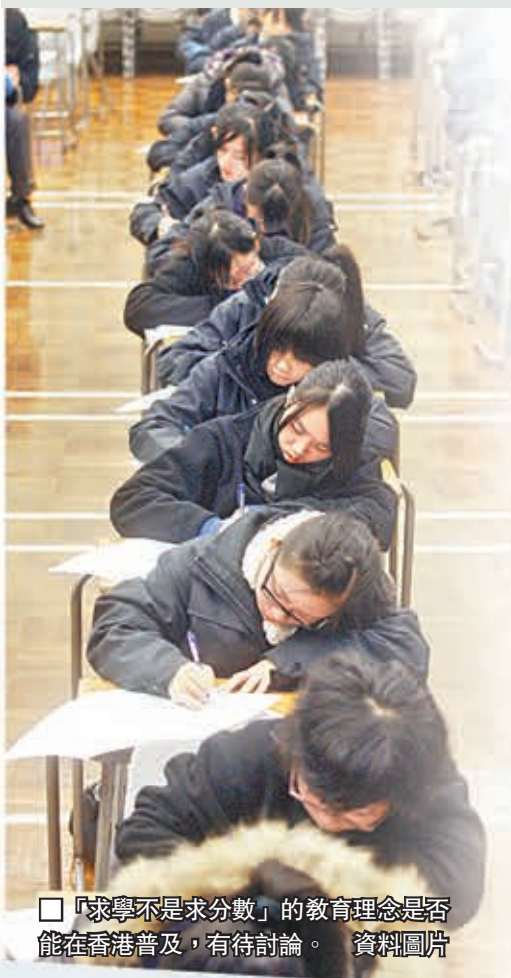
□「求學不是求分數」的教育理念是否能在香港普及，有待討論。