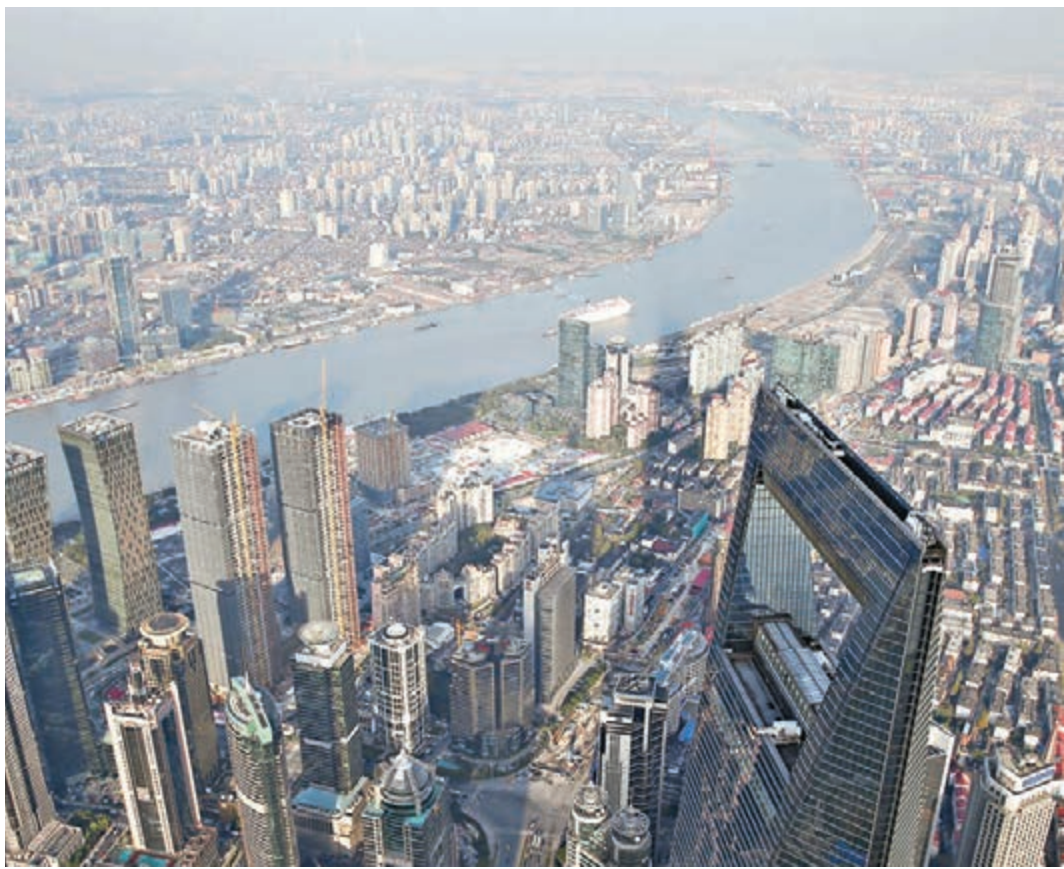
隨着人幣持續貶值,不少富豪級人馬開始紛紛將房產出售。 資料圖片

早前亦有報道指,馬來西亞首富郭鶴年正考慮出售部分在內地的產業,而自2012年開始,旗下的嘉里建設亦似乎每年都減少在內地的產業發展。