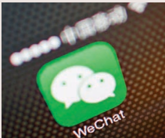
微信自3月1日起提現收取手續費,稱是因銀行要收取此筆費用,但銀行業界人士否認。 資料圖片

香港文匯報訊(記者孔雲瓊 上海報道)騰訊(0700)旗下的微信方面宣佈,自3月1日起提現收取手續費,並稱是因銀行要收取此筆費用。不過,馬上有銀行人士稱,提現行爲銀行是不收手續費的。