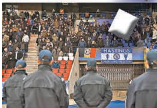
●本場大戰加強保安。