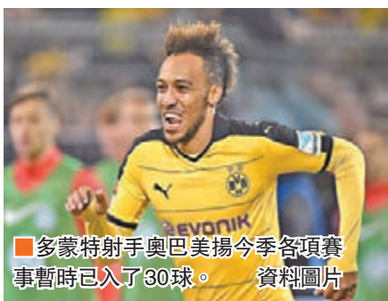
●多蒙特射手奧巴美揚今季各項賽事暫時已入了30球。 資料圖片

「紅軍」利物浦各項賽事連續5場不勝、足盃盃出局後，日前作客終於一吐烏氣，大炒阿士東維拉6:0，「玻璃人」前鋒史杜列治還取得入球。當然，後衛史卡迪爾與翼鋒拉爾拿繼續倦勤，確令領隊高洛普有所擔憂。