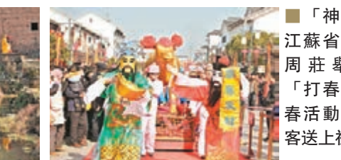
「神仙」在江蘇省蘇州市周莊舉行的「打春牛」新春活動中給遊客送上祝福。