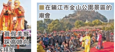
在鎮江市金山公園景區的廟會