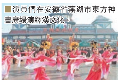
演員們在安徽省蕪湖市東方神畫廣場演繹漢文化。