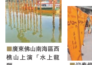
廣東佛山南海區西樵山上演「水上龍獅」

在四川省華盛市，各社區的文藝愛好者在華盛山廣場表演歌舞。在眉山市，市民在東坡宋城啟賢廣場舉辦迎春燈謎活動中猜燈謎，村民在丹枝縣大雅廣場進行舞龍表演。在峨眉山報國寺，來自各地的上萬香客絡繹不絕地趕到寺內爭搶新年頭炷香，祈福撞鐘，祈求來年一切順利！