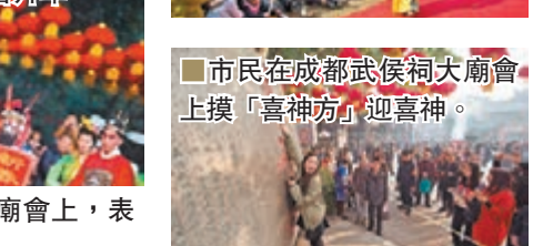
市民在成都武侯祠大廟會上摸「喜神方」迎喜神。