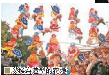
以猴為造型的花燈