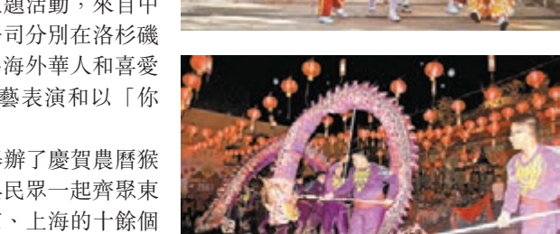
在印度尼西亞帕當市，人們在一個寺廟前舞龍慶祝中國農曆新年。