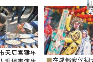
在山東省青島市天后宮猴年廟會上，烙畫藝人現場表演生肖烙畫製作工藝。