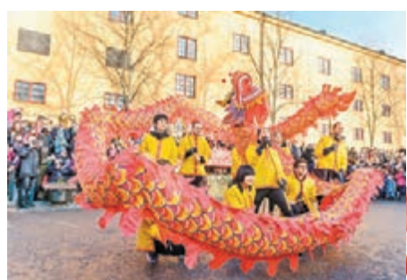
瑞典華僑華人舞龍舞獅喜迎猴年