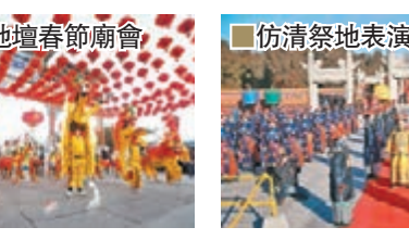
北京地壇春節廟會