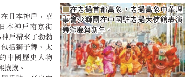
在老撾首都萬象，老撾萬象中華理事會少獅團在中國駐老撾大使館表演舞獅慶賀新年。

在瑞典首都斯德哥爾摩東亞博物館，亦舉辦了慶賀農曆猴年新春系列活動，眾多旅瑞華僑華人和瑞典民眾一起齊聚東亞博物館歡慶農曆春節。而由來自包括北京、上海的十餘個藝術方隊參與的盛裝巡遊在比利時首都布魯塞爾市中心舉行，為當地市民與遊客帶來濃濃的中國年味。