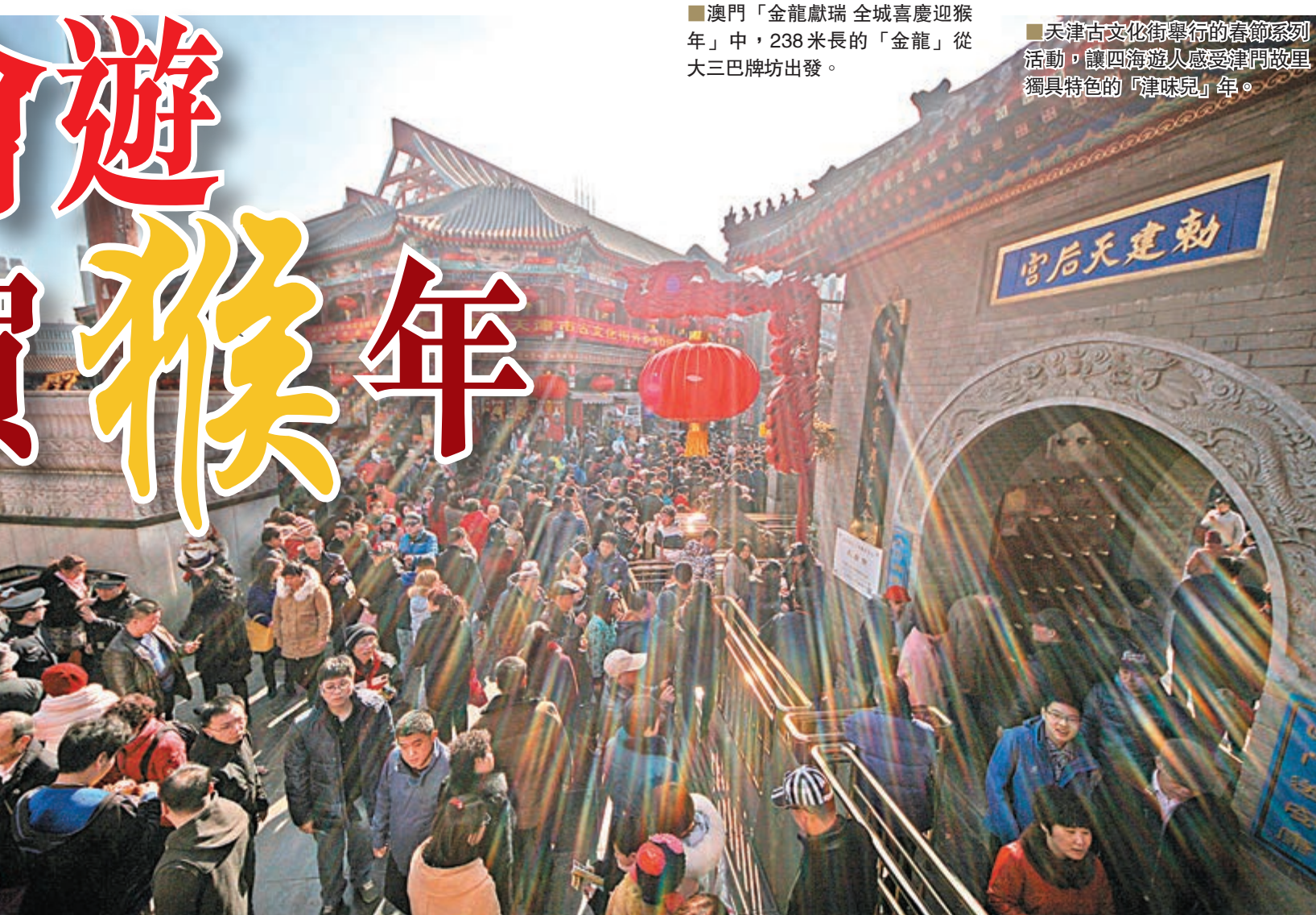
天津古文化街舉行的春節系列活動，讓四海遊人感受津門故里獨特特色的「津味兒」年。