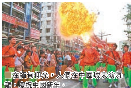
在緬甸仰光，人們在中國城表演舞龍，慶祝中國新年。