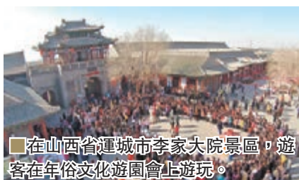
在山西省運城市李家大院景區，遊客在年俗文化遊園會上遊玩。