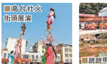
高合社火街頭展演