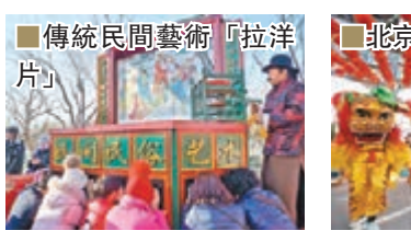
傳統民間藝術「拉洋片」