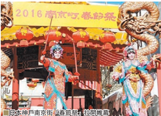
日本神戶南京街「春節祭」拉開帷幕