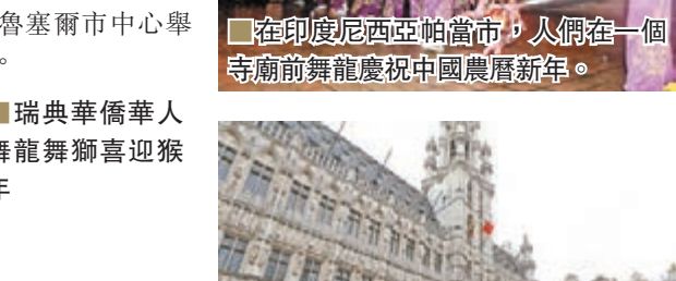
布魯塞爾上演中國春節盛裝巡遊