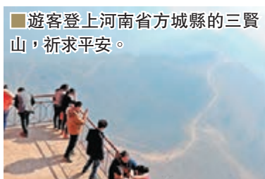
遊客登上河南省方城縣的三賢山，祈求平安。