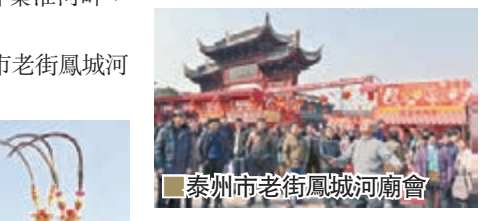
泰州市老街鳳城河廟會