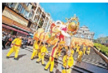
澳門「金龍獻瑞 全城喜慶迎猴年」中，238米長的「金龍」從大三巴牌坊出發。