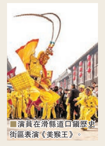
演員在滑縣道口鎮歷史街區表演《美猴王》。