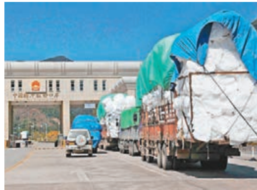
雲南計劃「十三五」期間全省貨物進出口總額達500億美元。圖為在雲南騰沖猴橋口岸等待出關的貨車。

為此，雲南提出「三大戰略」：一是「開放強省」，將雲南打造成經濟高度開放、貿易高度自由、投資高度便利、金融高度創新、監管高效安全的開放先導區；二是「流通活省」，強化創新驅動、改革驅動，協同推進流通信息化、標準化、集約化，降低流通成本，提高流通效率；三是「市場興省」，引導市場由單一交易功能向物流、會展、電商、跨境電商、金融服務等多功能集成發展。