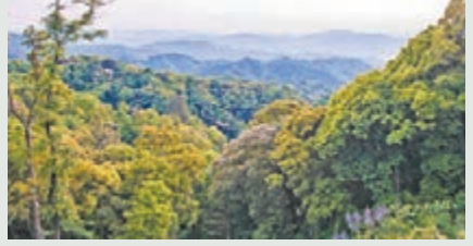
福建省被譽為「最綠省份」，圖為福建天寶岩國家級自然保護區。本報福建傳真

據悉，福建省級財政將安排專項資金對植樹造林進行補助，其中：高速公路(鐵路)森林生態景觀通道建設每畝補助1萬元(人民幣，下同)；鄉村生態景觀林建設每畝補助1萬元；生物防火林帶建設每畝補助1,000元等。