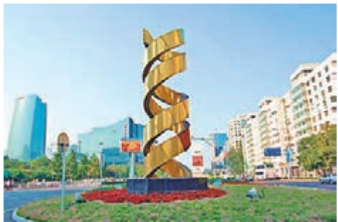
去年中關村示範區企業年度專利申請量創新高。圖為中關村科技園海澱園。

香港文匯報訊(記者 劉凝哲 北京報導)記者日前獲悉，2015年中關村示範區企業年度專利申請量和授權量雙雙創歷史新高。其中，年度專利申請量首次達60,603件，佔同期全市專利申請量的42.6%；而年度專利授權量則首次突破3萬件。此外，小米等四家企業發明申請量躋身內地十強。