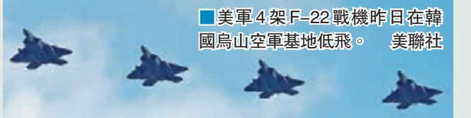
美軍4架F-22戰機昨日在韓國烏山空軍基地低飛。

朝鮮核試及發射長程火箭後，美國持續加強在朝鮮半島的軍事動作，美軍昨日再出動4架F-22「猛禽」隱形戰機在韓國上空低飛，警告平壤勿輕舉妄動。 4架F-22戰機昨日從美軍日本嘉手納基地出發，飛抵韓國京畿道烏山空軍基地並低空飛行。據悉，其中兩架戰機將返回嘉手納基地，其餘兩架將留在烏山基地一段時間。這款隱形戰機的最大優勢為可潛入朝鮮半島空域，對朝鮮最高領導人金正恩的辦公所在地或朝鮮核設施實施核轟炸。 有分析認為，前日是朝鮮已故領導人金正日冥壽，金正恩未率高官參謁，而是獨自參謁安放金日成和金正日遺體的錦繡山太陽宮，或與美國向韓國出動戰略武器有關。 ■韓聯社