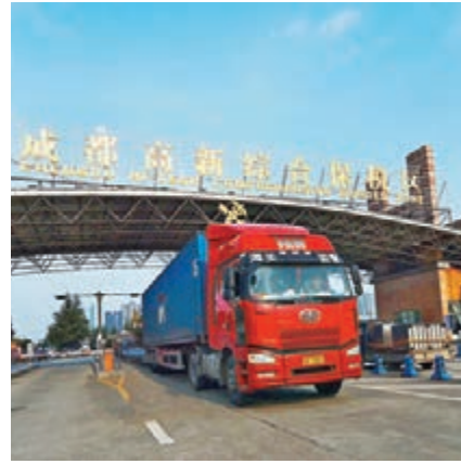
成都高新區綜合保稅區。