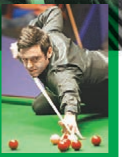
奧蘇利雲一向我行我素。資料圖片

另一爭議事件是1996年世錦賽對加拿大球手阿蘭羅賓度，素來以右手握「Cue」的奧蘇利雲，突然改用左手作賽，令羅賓度有感遭到輕視，「火箭」當時聲稱自己的左手其實打得好。及後「火箭」到聽證會作供，並以左手跟前世錦賽亞軍威廉斯連打3局，最終「火箭」全數勝出，其指控亦得以撤銷。