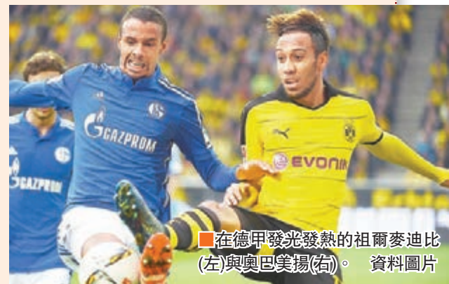
在德甲發光發熱的祖爾麥迪比(左)與奧巴美揚(右)。