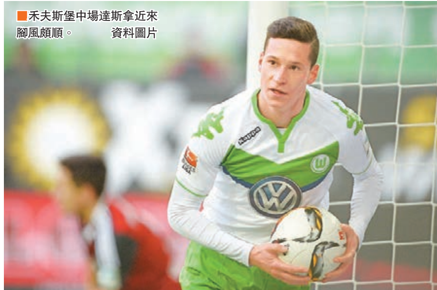
禾夫斯堡中場達斯拿近來腳風頗順。