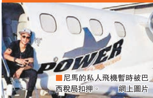
尼馬的私人飛機暫時被巴西稅局扣押。

巴塞羅那上輪西甲大勝切爾達6：1，而尼馬亦攻入了自己本賽季西甲的第17球。不過球場外，尼馬卻因為涉嫌逃稅而於日前遭巴西法院凍結了共值4300萬歐元（約3.7億港元）的資產，其中包括他去年才買入的私人飛機。