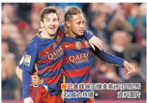
巴塞鋒線王牌美斯(左)同尼馬(右)威力持續。

去年12月世界冠軍球會盃賽期至今，巴塞羅那在聯賽仍然少踢1輪，不過已經夠積分優勢高踞榜首。挾着日前大炒切爾達6：1的霸氣，明晨西甲第24輪補賽作客遇上倒數第5位的希杭，以「MSN」箭頭現時的勢頭，贏波應問題