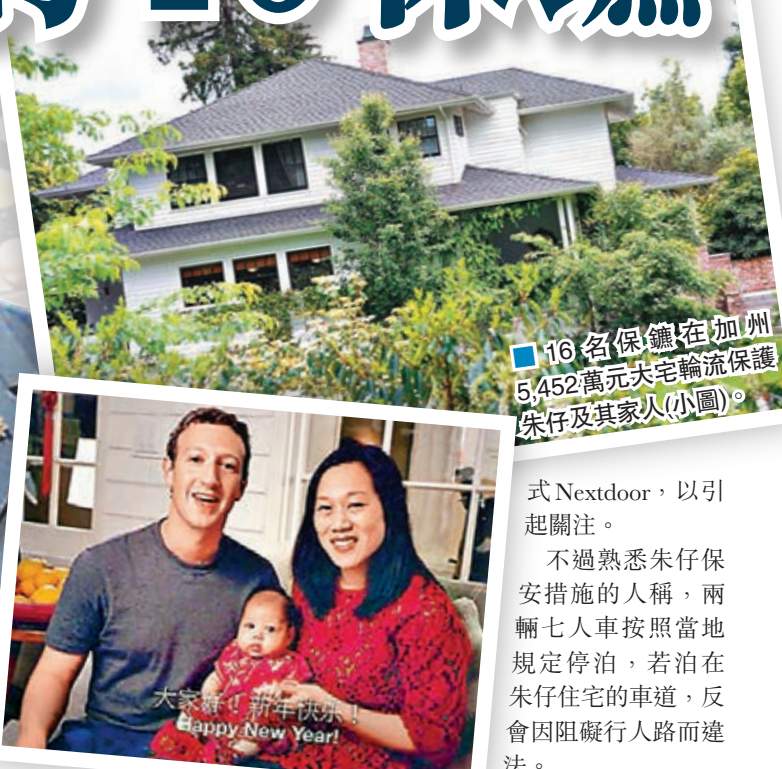
16名保鏢在加州5,452萬元豪宅輪流保護朱仔及其家人(小圖)。

消息人士指出，矽谷企業總裁接觸數以億計用戶，所有總裁幾乎都受過一些「情緒不穩」的用戶恐嚇，為安全起見，他們會非常認真看待，並採取嚴格保安措施。