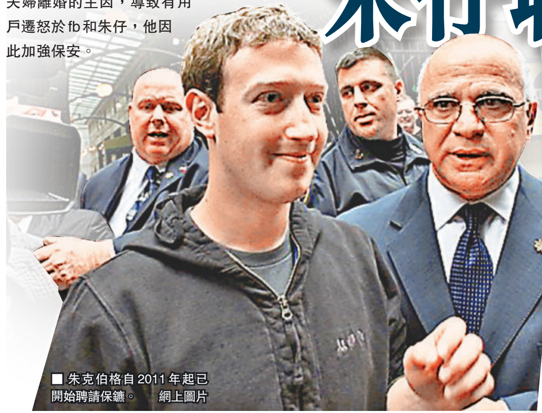
朱克伯格自2011年起已開始聘請保鏢。