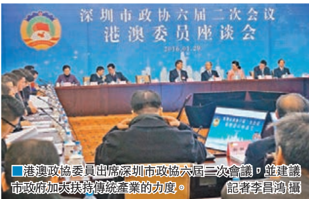
■港澳政協委員出席深圳市政協六屆二次會議，並建議市政府加大扶持傳統產業的力度。

深圳市政協六屆二次會議日前舉行，港籍政協委員提交了三份提案，均建議深圳市政府積極出台一些相關政策，將扶持傳統產業與扶持新興產業放在同等重要地位，從稅收、投資和金融等多方面進行系統扶持，設立傳統產業轉型升級發展基金，用於扶持和獎勵傳統產業升級，促進企業由價值鏈低端轉向中高端。