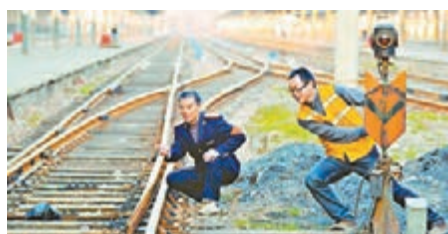
■鐵路南京站的扳道工在扳道岔。 本報南京傳真