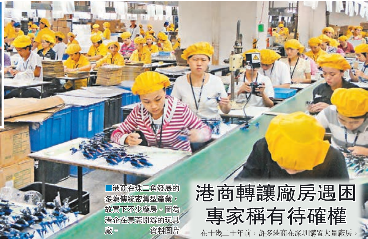
■港商在珠三角發展的多為傳統密集型產業，故買下不少廠房。圖為港企在東莞開辦的玩具廠。