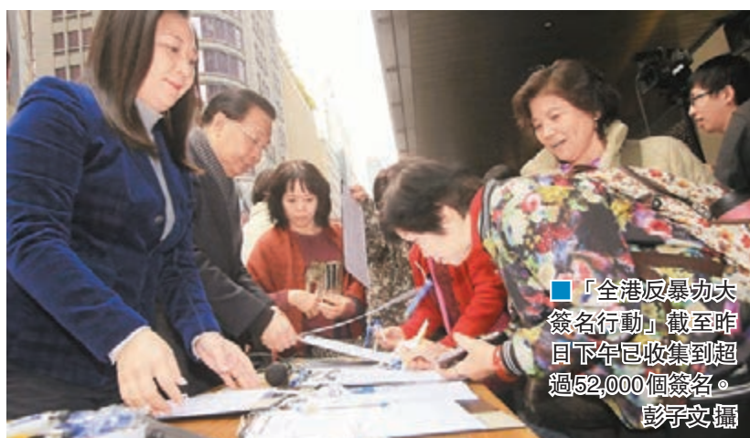
■「全港反暴力大簽名行動」截至昨日下午已收集到超過52,000個簽名。