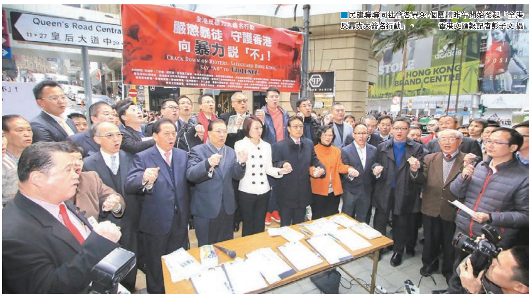
■民建聯聯同社會各界94個團體昨午開始發起「全港反暴力大簽名行動」。

民建聯發言人表示，他們希望藉着是次簽名行動，向社會傳達香港市民及各界反暴力的訊息，並向所有暴徒發出最嚴厲譴責。民建聯還要求當局必須盡快將所有目無法紀、破壞社會安寧的暴徒繩之以法，予以嚴懲，以儆效尤。市民可於本月底或之前可在18區開設的街站簽名，亦可到網址 https://starry.nt3.hk/q 提交網上簽名。