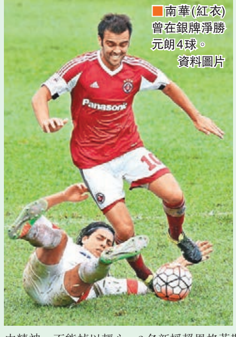
南華(紅衣)曾在銀牌淨勝元朗4球。

香港文匯報訊(記者 潘志南)港超聯賽進入爭標白熱化階段，南華今晚8時在將軍澳主場迎戰元朗，非勝不可。門票分收80元、長者及學生特惠票30元兩種。南華目前在積分榜以18分位列第3位，餘下7場聯賽必須盡力爭勝，同時寄望榜首東方失分，才有望贏得聯賽冠軍，故今仗對元朗絕對不容有失。