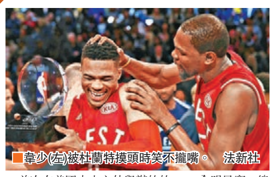
韋少(左)被杜蘭特摸頭時笑不攏嘴。