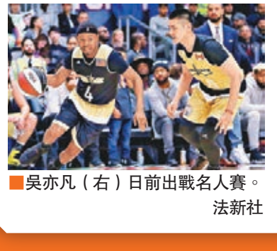
吳亦凡(右)日前出戰名人賽。