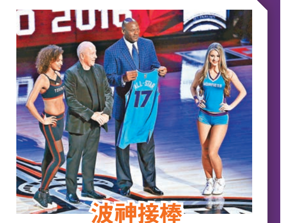
波神接棒 黃蜂班主、「波神」米高佐敦(右2)接過一件印上「17」號的球衣，代表2017年全明星賽將由夏洛特主辦。

保羅佐治險破張伯倫紀錄 勇士球星史提芬居里是役得到26分，最後2.6秒，兩隊都無心戀戰，咖哩仔在全場的「起哄」下，在幾乎半場位置命中超遠3分球，點爆了球場。鵜鶘球星安東尼戴維斯13投12中，得到24分，雷霆前鋒杜蘭特則連進23分，不過溜馬前鋒保羅佐治為東岸砍下41分，距離張伯倫全明星賽單場最高的42分紀錄只差1分。