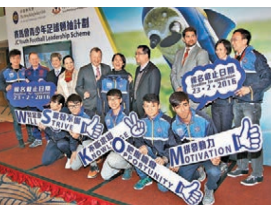
賽馬會青少年足球領袖計劃接受報名。

李麗珊昨日以「2016年賽馬會青少年足球領袖計劃」導師身份出席記者會，談到巴西寨卡病毒威脅里約時，她指出：「作為一個運動員，我不會理會這些，會繼續集中訓練，努力這麼多年都是為了今日(指奧運)。」珊珊表示運動員能參加奧運是最終目標，絕不會因為這病毒肆虐而放棄參賽，當然要十分小心和認識如何防止受蚊叮咬上病毒。她又指其實主辦國更為緊張，距離奧運尚餘半年，賽會會處理好奧運環境。