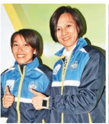
李麗珊(右)與陳婉婷。

香港文匯報訊(記者 潘志南)寨卡病毒威脅今年8月的里約熱內盧奧運會，作為參加過4屆奧運會的過來人、「風之後」奧運金牌得主李麗珊(珊珊)認為，運動員絕不會受病毒威脅而卻步，而珊珊還為香港代表團寄予備戰心得。