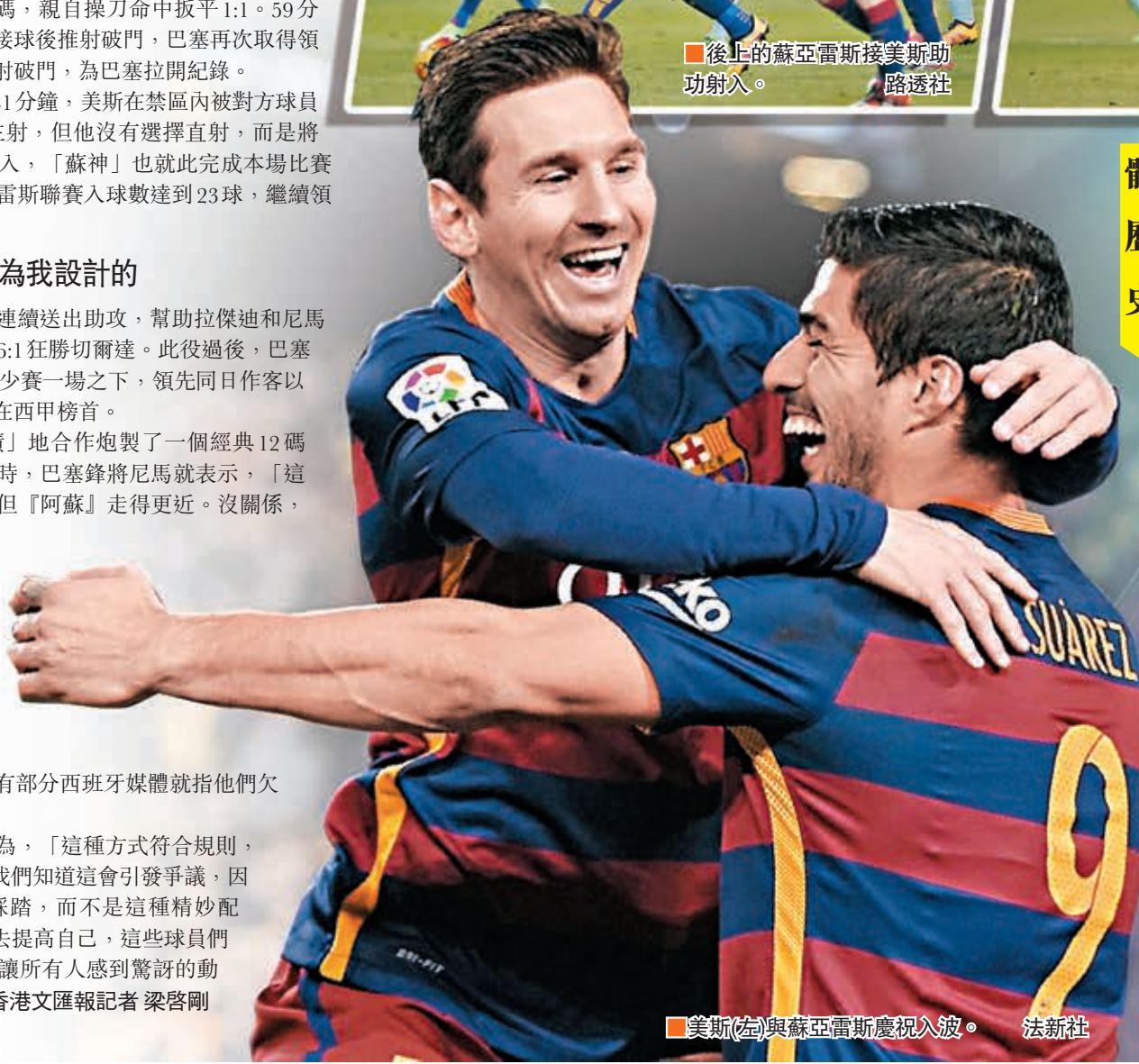
美斯(左)與蘇亞雷斯慶祝入球。