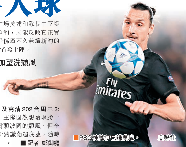
PSG神鋒伊巴謙莫域。

與此同時，葡超勁旅賓菲加將在主場迎戰俄超的辛尼特(有線62台及高清202台周三3:45a.m.直播)，主隊固然想藉取勝一洗聯賽不敵死對頭波圖的頹風，但辛尼特教頭波亞斯熱識葡超底蘊，隨時可施奇招「偷雞」。 記者 鄺御龍