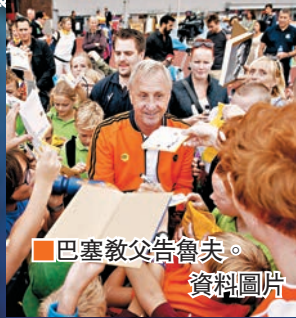
巴塞教父告魯夫。資料圖片

如此處理12碼，成功的，當然就「名留青史」，但萬一失手，就真的「遺臭萬年」。2005年10月的英超賽事，阿仙奴對曼城的役，亨利、皮利斯也曾經以同樣手法處理12碼；皮利斯主罰12碼時選擇輕撥皮球，沒想到第一腳踢空，這一下打亂了後上的亨利，這位法國前鋒竟沒有踢到皮球。 記者 梁啟剛