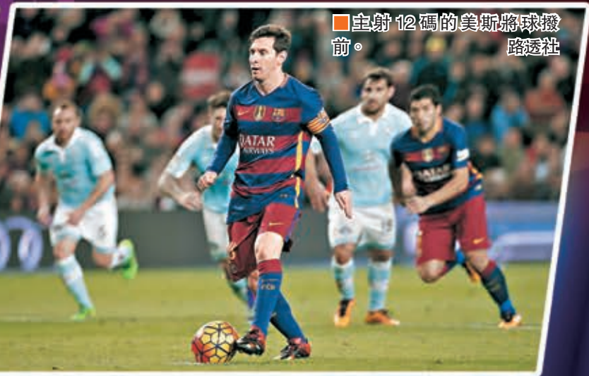
主射12碼的美斯將球撥前。