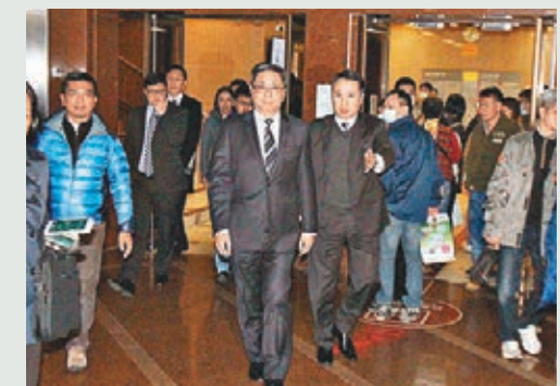
警務處處長盧偉聰昨日傍晚到伊利沙伯醫院,探望旺角暴亂中受傷留醫的最後一名警員。

O記已就旺角區的暴亂事件設立24小時熱線2527-7887,呼籲市民提供資料,致電熱線與調查人員聯絡。