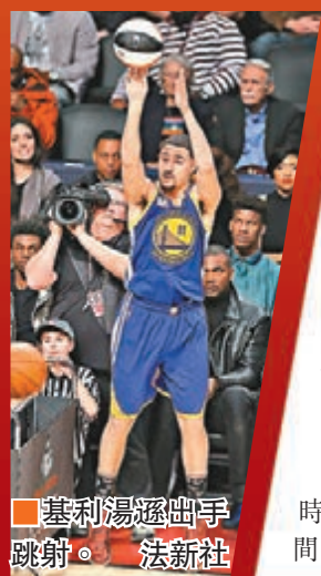
基利湯遜出手跳射。