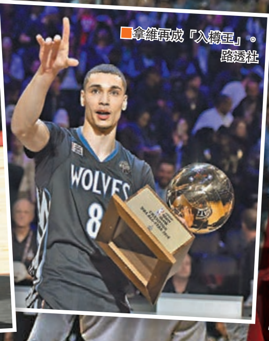
拿維再成「入樽王」。