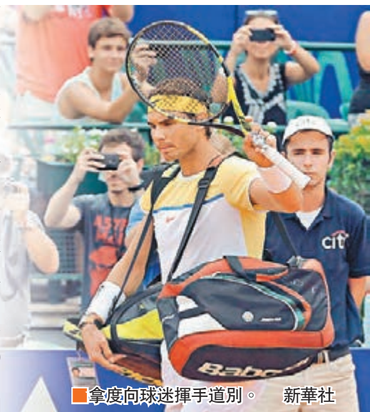
拿度向球迷揮手道別。