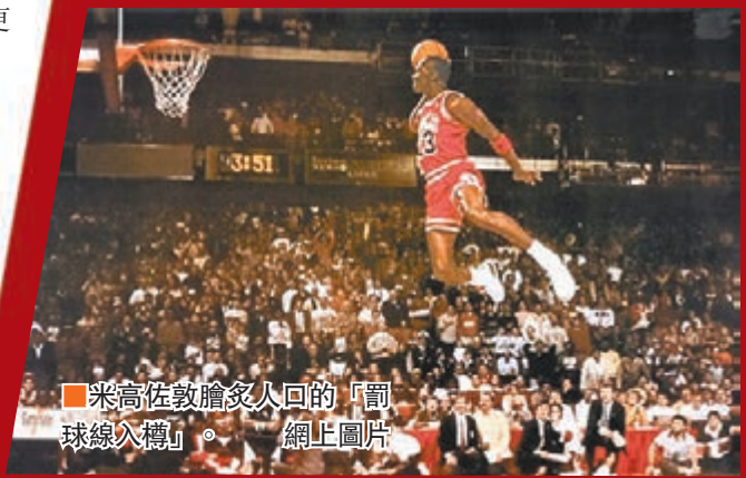
米高佐敦膾炙人口的「罰球線入樽」。