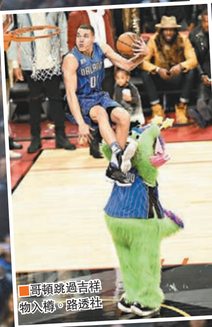
哥頓跳過吉祥物入樽。