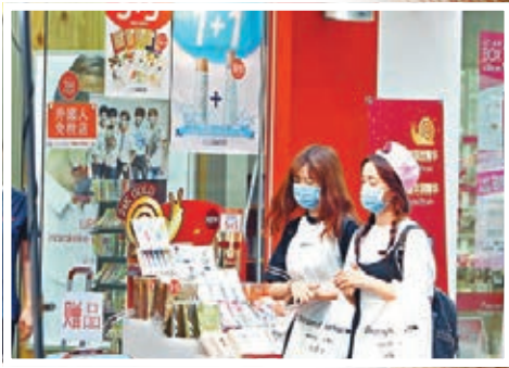
盧亨燮預言，香港將如韓國般出現類似「新沙士」的疫情。資料圖片

今日適逢初七人日，先祝願各位讀者生日快樂！送羊迎猴，本報春節前特意邀請了韓國著名的堪輿學家盧亨燮博士批算香港今年在各方面的運勢，盼給讀者帶來有益啟示。他預測香港有機會再出現小型的「雨傘運動」，不幸已經言中了，初一旺角街頭發生了暴亂事件。還有，盧博士還指香港今年運勢差，經濟陷冬眠期，不宜投資，但市民只要團結一致，齊齊捱過今年，2017年則可轉好。