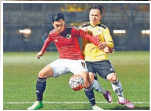
香港體育發展要加強。資料圖片