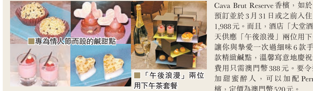
專為情人節而設的鹹甜點 「午後浪漫」兩位用下午茶套餐

在香港，天際100香港觀景台（天際100）由即日起至2月29日期間呈獻「情約在天際」推廣活動，特別推出「情人節限定—Sky & Wine 自訂雕刻酒樽套票」及「Sky & Koo 天際甜蜜時刻朱古力套票」，讓你和摯愛伴侶在393米高空，360度俯瞰香港不同景觀及維港景色，度過與別不同的情人節。