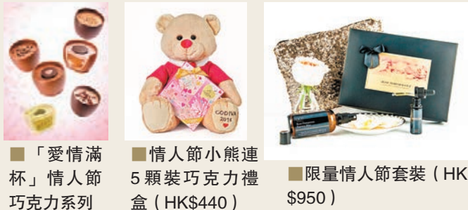
「愛情滿杯」情人節巧克力系列 情人節小熊連5顆裝巧克力禮盒 (HK$440) 限量情人節套裝 (HK$950)

而001 LONDON 更首次於香港推出限量情人節套裝，套裝包括大馬士革玫瑰精華噴霧100ml、尊貴精髓精華油10ml及精美化妝袋，讓你和愛人沉醉至大馬士革玫瑰的浪漫傳奇世界。