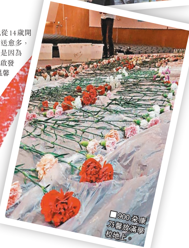
■900朵康乃馨放滿學校地上。