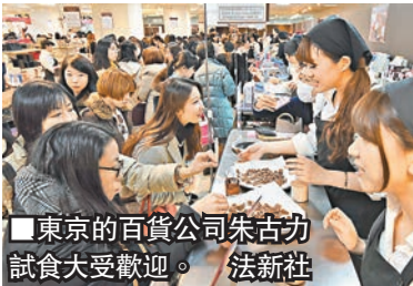
■東京的百貨公司朱古力試食大受歡迎。 ■法新社

為了情人節這個大日子，日本各地百貨公司在個多月前已經嚴陣以待，甚至將整層都變成朱古力專賣場，當地朱古力市場每年110億美元(約857億港元)銷售額中，半數來自2月，可見情人節的威力。大阪今年更有百貨公司推出鑲有125顆鑽石、價值12.5萬美元(約97.4萬港元)的超豪華朱古力蛋糕。 ■法新社