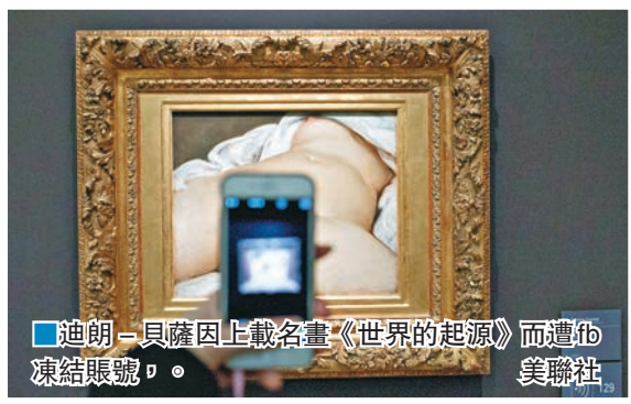
■迪朗-貝薩因上載名畫《世界的起源》而遭fb凍結賬號。

藝術作品 ：雖然fb目前容許上載有關「描繪裸體的畫作、雕像及其他藝術品」的圖片，但仍然不時有用戶因此遭到警告或凍結賬號。美國藝術家索爾次早前因上載中世紀裸體畫而遭凍結賬號；紐約一間畫廊上月貼出一名女藝術家赤裸上身坐在馬桶的照片後，賬號亦遭凍結。 ■美聯社