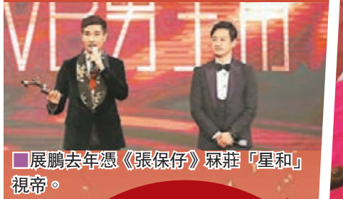
展鵬去年憑《張保仔》稱「星和」視帝。