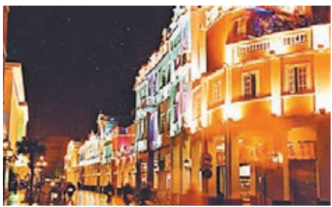
「十三五」期間，廣州將打造西關長堤景觀帶。圖為長堤騎樓街。

香港文匯報訊(記者 鍾俊峰 廣州報導)從西關到長堤，是老廣州近現代歷史和記憶最為集中的地方。「十三五」期間，廣州將打造能夠承載老廣州文化記憶的珠江沿岸景觀帶，挖掘歷史文化遺產，形成現代服務業新增長點，增強文化可持續發展的活力。