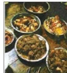
江西農村男友這頓年飯把上海女友嚇跑了。網上圖片

該事件在網上引發熱議，網友@何磊說：「事件中的女孩是沒家教，這對情侶分了也是對的，我只想說事件中的男主角眼光才是差！」網友@雪蓮花開說：「既然你都已經來了，作為一個有素質的上海人，何不堅持一下，等回去再考慮分手的事。」 ■ 新華網