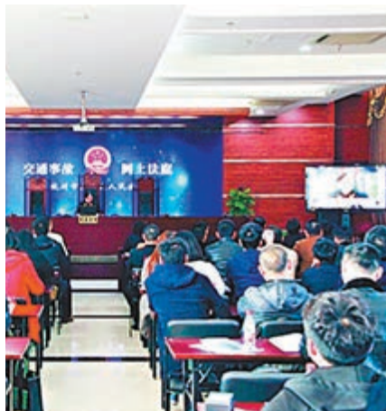
浙江省積極打造「智慧法院」。圖為交通事發網上法庭。