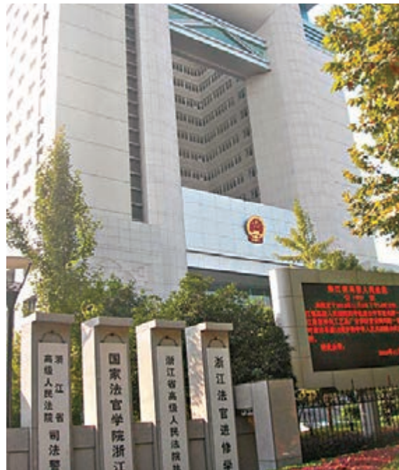
浙江省高級人民法院外觀。網上圖片

香港文匯報訊(記者 俞畫 杭州報導)浙江省十二屆人大四次會議日前舉行第二次全體會議，浙江省高級人民法院代院長陳國猛指出，全省法院去年擴大裁判文書上網範圍，公佈裁判文書165萬份，居內地法院首位，99.8%的涉訴資產通過淘寶網公開拍賣。此外，該省積極探索「互聯網+審判」改革，藉助雲計算、大數據和用戶方面的資源優勢，打造「智慧法院」。