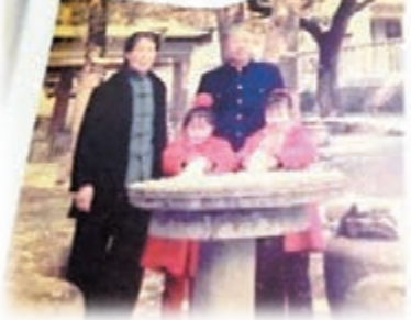
《聽奶奶講故事》一書的封面，是爺爺奶奶和孫女外孫女的雪中合影。網上圖片

「星星」的奶奶在老家山東文登，爺爺是軍人，年輕時就遠離故鄉，新中國成立後在舟山落腳。一手把五兒一女撫養成成人，現在整個家族早已子