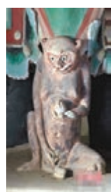
敦煌壁畫千年猴形象製成電子年曆。網上圖片

猴年新春，猴子倍受矚目。在敦煌的千年壁畫上，至今仍保留着許多猴子形象。敦煌研究院近日發佈了一份猴年電子年曆，12隻敦煌壁畫中的猴子形態可愛，生動活潑。