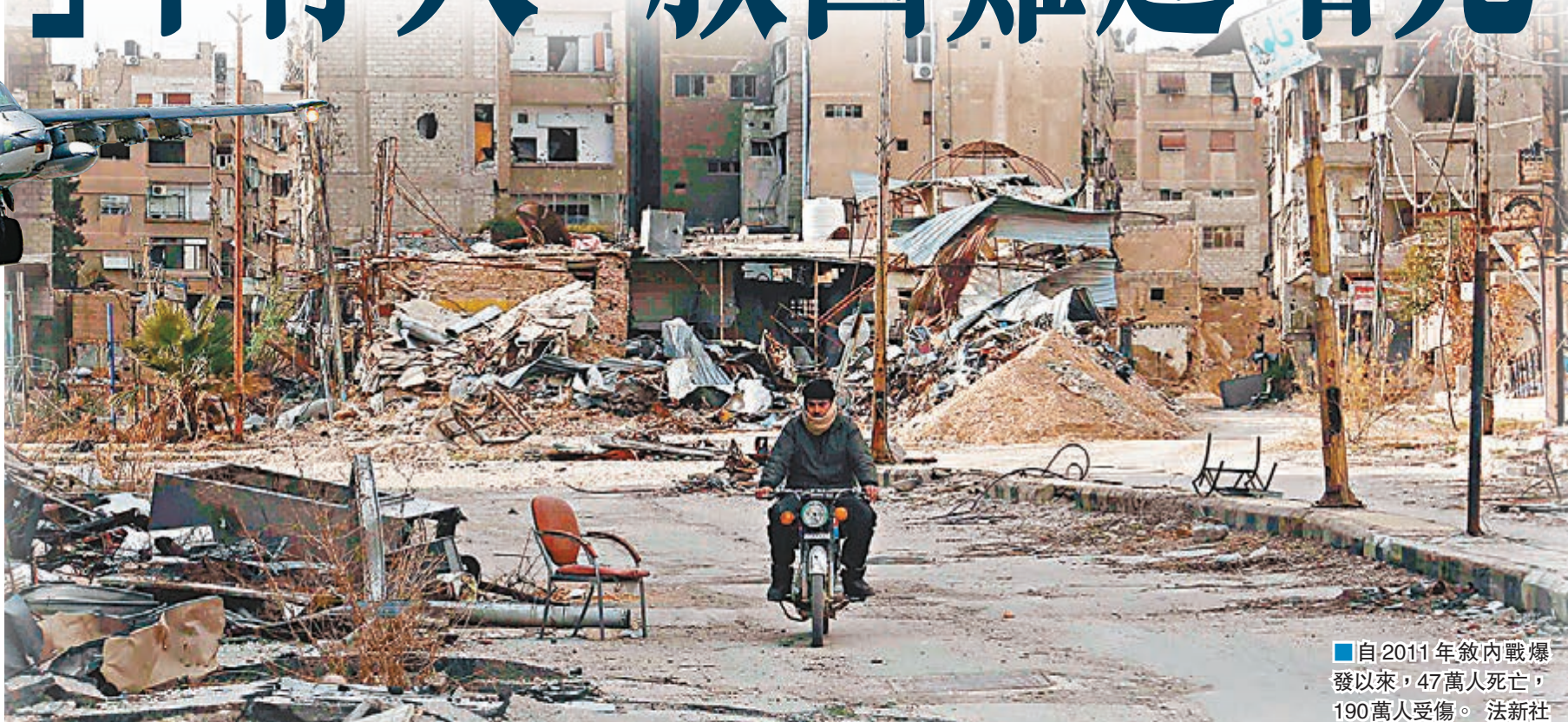
■自2011年敘內戰爆發以來，47萬人死亡，190萬人受傷。