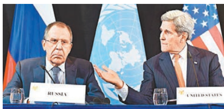
■美國國務卿克里(右)和俄羅斯外長拉夫羅夫昨日共同宣佈會談成果。