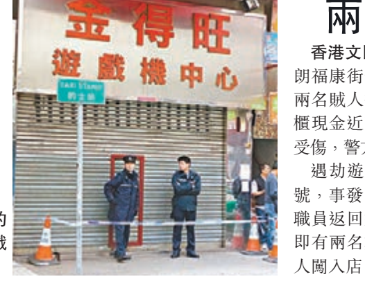
遇劫的元朗遊戲機舖。