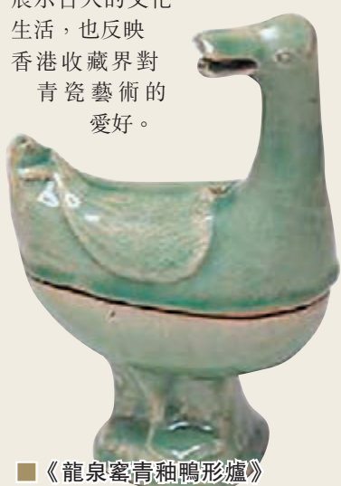
■ 《龍泉窰青釉鴨形爐》明十六世紀

瓷器是研究古代社會的可靠實物材料。是次展品包括不少茶具及酒器，例如北宋執壺、元代高足盃，明代盞托等，顯示古人品茶嗜酒習慣。至於香爐器物，分別有三足爐、盃式爐、鴨形爐、甬