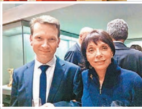
■ 易凱及趙無極遺孀法蘭索瓦絲·馬凱